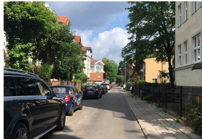
UL. PARKOWA - ODCINEK OD CHROBREGO DO DRZYMAŁY