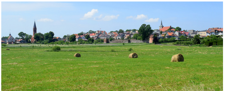
Skarszewy-panorama z zachowanym fragmentem dawnych murów obronnych.