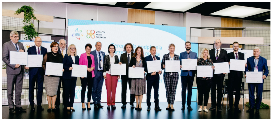
11 października 2021 r. prezydenci i burmistrzowie 16 polskich miast podpisali w Poznaniu Europejską Kartę Równości Kobiet i Mężczyzn w Życiu Lokalnym.

Ceremonię podpisania Europejskiej Karty Równości Kobiet i Mężczyzn w Życiu Lokalnym zorganizowały 11 października