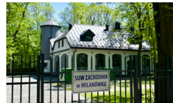
Stacja uzdatniania wody w Milanówku.