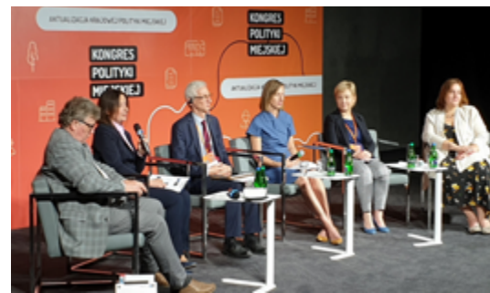
Podczas Kongresu Polityki Miejskiej doradcy miast przedstawili doświadczenia z wdrażania projektu predefiniowanego.

Kolejne dwa aspekty, które prowadzą do powodzenia w programowaniu przyszłego rozwoju miasta, to administracja angażująca-