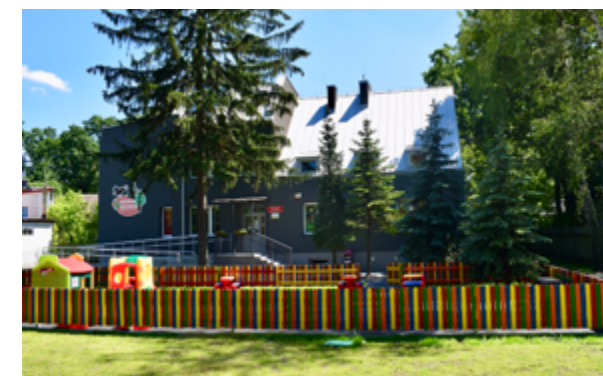
Żłobek „Akademia Jerzyków” w Milanówku.

października 1945 r. – przechowywano wywiezioną w czasie powstania z kościoła św. Krzyża urnę z sercem Fryderyka Chopina. Dla pasjonatów odkrywania uroków dawnych lat, miasto oferuje trzy ścieżki spacerowe - Szlak „Wille Milanowskie” z obiektami zabytkowej architektury, szlak „Mały Londyn” związany z historią II wojny światowej i „Szlak Jedwabny” związany z produkcją jedwabiu.