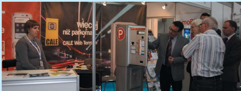
Podczas targów GMINA 2009 prezentowano różnorodną ofertę dla samorządów.