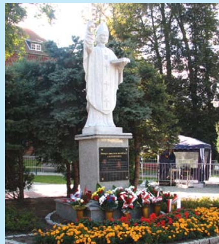
Pomnik św. Brunona Bonifacego z Kwerfurtu w Bartoszycach.

W Łądku-Zdroju ogłoszono nawet niedawno konkurs na patrona miasta, podkreślając m.in., że należy wskazać na związki kandydata z historyczną tradycją miasta. Konkurs „wygrał” św. Jerzy, a autor pomysłu otrzymał na sesji Rady Miasta nagrodę. W Zielonej Górze Stowarzyszenia Winiarzy zawiązało społeczny komitet na rzecz ustanowienia św. Urbana I Papieża, patrona winiarzy, patronem miasta.