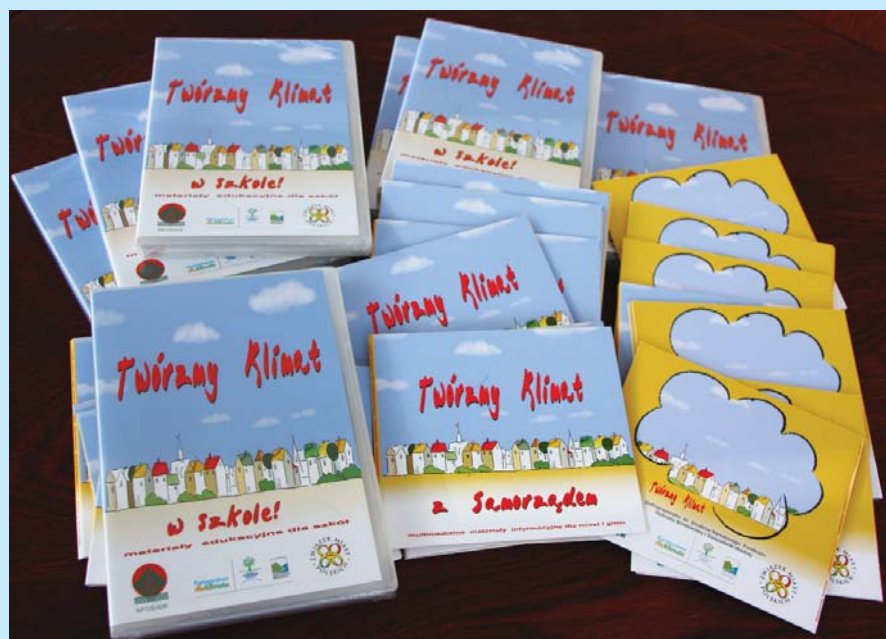
Edukacyjne i informacyjne materiały multimedialne zrealizowane przez Związek w ramach projektu „Program edukacyjno-informacyjny na rzecz aktywnego udziału władz samorządowych w ochronie klimatu”.

Szczególnym odbiorcą efektów działań prowadzonych w ramach pro-