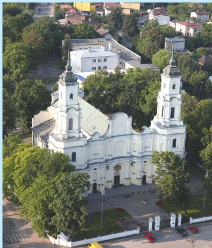
Kościół św. Trójcy w Kobyłce.

M iaasto jest atrakcyjnym miejscem do osiedlania się i prowadzenia firm, gdyż łączy dwie zalety: leży nieopodal Warszawy, a równocześnie gwarantuje zacisze, dzięki okolicznym terenom leśnym i niskiej zabudowie. Dzięki temu w ostatnich latach intensywnie rozwija się tu budownictwo mieszkaniowe, powstają domy jedno- i wielorodzinne. Wraz z nimi przybywają nowi mieszkańcy. Warto podkreślić, że niemal cała powierzchnia Kobyłki pokryta jest planami zagospodarowania przestrzennego. Atutem miasta jest też dobra sieć połączeń komunikacyjnych: linia kolejowa, włączona w strefę „wspólnego biletu” z transportem miejskim Warsza-