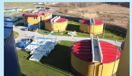
Nowa oczyszczalnia ścieków w Piasecznie.

Dobiega końca realizacja największej w historii gminy Piaseczno inwestycji współfinansowanej z unijnych środków Funduszu Spójności. Chodzi o „Program gospodarki wodno-ściekowej”.