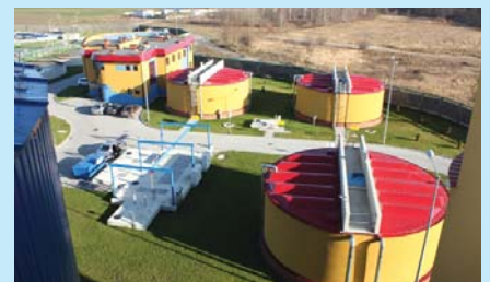
Nowa oczyszczalnia ścieków w Piasecznie.

Dobiega końca realizacja największej w historii gminy Piaseczno inwestycji współfinansowanej z unijnych środków Funduszu Spójności. Chodzi o „Program gospodarki wodno-ściekowej”.