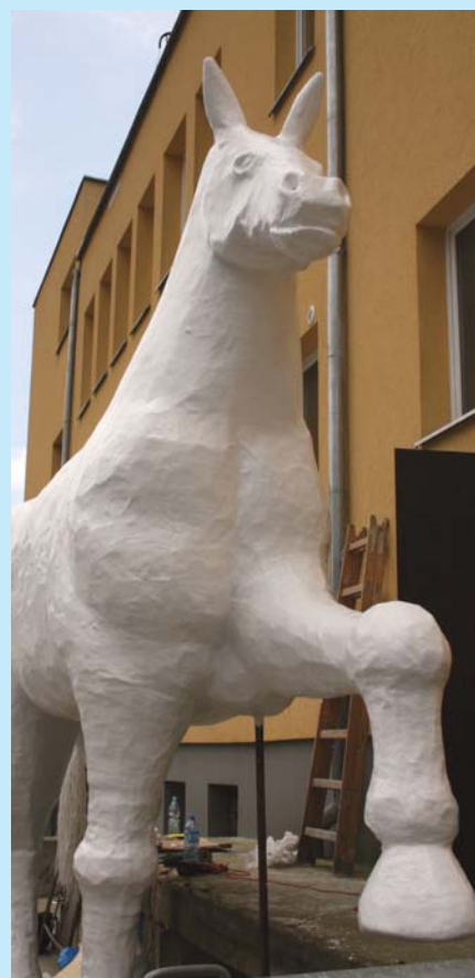
Pomnik Kobyły Niepodległości w Kobyłce.

Na Dni Kobyłki do miasta przybyła Kobyła Niepodległości – czterometrowy koń z metalowych rur i styropianu, który powstał w stolicy na uczczenie 20-lecia wolności. Po przeprowadzeniu 30 maja br. Krakowskim Przedmieściem korowodu zwycięstwa, biała Kobyła została uroczystie przetransportowana do Kobyłki, gdzie stanęła przed Domem Kultury. Ma być symbolem miasta, a jednocześnie propagatorką idei niepodległości, bo przecież niedaleko stąd w Ossowie rozegrała się bitwa z bolszewikami, uznawana za jedną z dwudziestu najważniejszych w historii świata.