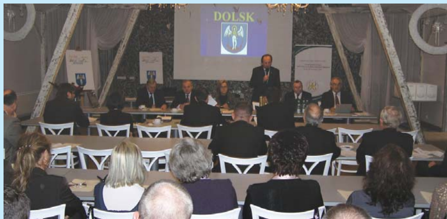
Konferencja poświęcona patronom polskich miast w Dolsku.