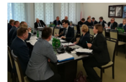
Posiedzenie Komisji Samorządu Terytorialnego i Administracji Państwowej, 8 stycznia 2020 r.