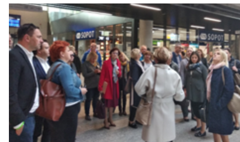
Uczestnicy wizyty studyjnej w Sopocie.

Ten niełatwy projekt przebudowy ogromnej części miasta, wykonywany w terenie objętym ochroną konserwatorską, jedno-