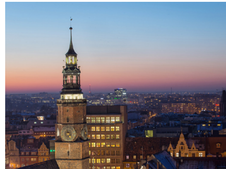
Wrocław po 15 latach wrócił do Związku Miast Polskich.

miast. Póki te cele były realizowane, póty Bolesławiec był członkiem ZMP. - Zmiany, które obserwujemy w okresie ostatnich lat, przywróciły wiarygodność władz statutowych ZMP, a podejmowane działania znów mają na celu obronę interesów mieszkańców miast - czytaliśmy na oficjalnej