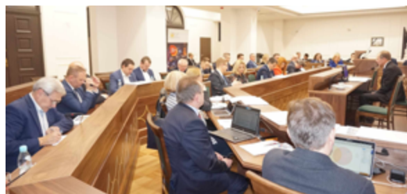
W poczet miast członkowskich Zarząd Związku Miast Polskich przejął kolejne miasta: Bolesławiec, Łądek-Zdrój i Pińczów. Do ZMP należy już 325 miast – najwięcej w całej powojennej historii Związku.

Niemniej ważne są zmiany ustaw ustrojowych. Samorządowcy z miast chcą wylimitowania zakazu łączenia mandatu senatora z mandatami oraz funkcjami samorządowymi, a także zapisania klauzuli generalnej samorządu terytorialnego (gmina określa samodzielnie sposób realizacji zadań własnych). Oprócz tego niezbędne jest też przywrócenie JST prawa strony w postępo-