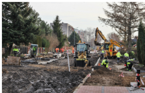
Przebudowa ulicy Bolesława Śmiałego.

roczna budowa ulicy Bolesława Śmiałego - ważnego ciągu komunikacyjnego spinającego wcześniejsze przedsięwzięcie związane z budową sześciu sąsiednich ulic. Razem w mieście powstało blisko 3,5 km dróg.