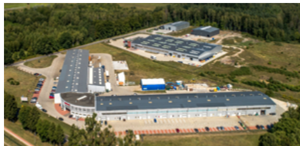
Białogard-Inkubator Technologiczny oraz Białogardzki Park Inwestycyjny INVEST-PARK.

Do realizacji zadań inwestycyjnych Białogard pozyskuje pieniądze zarówno unijne, jak i krajowe. Jednym z ważniejszych zadań jest budowa i przebudowa ulic - w ostatnich latach powstało łącznie kilkadziesiąt dróg i chodników. Wiele inwestycji prowadzonych jest kompleksowo, jak np. tego-