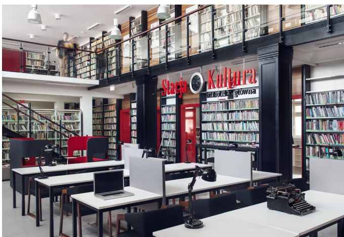
Stacja Kultura - główna siedziba Miejskiej Biblioteki Publicznej w Rumi - jest pierwszą tego typu placówką w Polsce, która została otwarta na czynnym dworcu. Zapoczątkowała tym samym nowy trend rewitalizacji dworców na cele kulturalne.