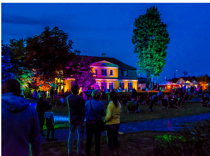
Festiwal światła w Rumi.