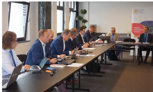
W poczet miast członkowie Zarządu ZMP przyjęło 3 miasta: Barcin (kujawsko-pomorskie), Biłgoraj (lubelskie) oraz Łaziska Górne (śląskie). Już 321 miast należy do Związku.

Wiele pytań i wątpliwości zgłosili samorządowcy z miast w związku z naborem do Funduszu Dróg Samorządowych. Ich zdaniem, cały proces przyznawania środków publicznych z tego Funduszu, jest mało przejrzysty i nietransparentny. Od 3 miesięcy strona samorządowa Komisji Wspólnej Rządu i Samorządu Terytorialnego prosi o przekazanie pełnej informacji o skutkach pierwszego naboru w ramach Funduszu Dróg Samorządowych. Do tej pory nie udało się uzyskać na przykład danych na temat pełnych wyników naboru wskazującego, które samorządy objęła korekta wniosków, które samorządy otrzymały środki i jakie w drodze indywidualnej decyzji Prezesa Rady Ministrów, a którym przyznano dofinansowanie do projektów,