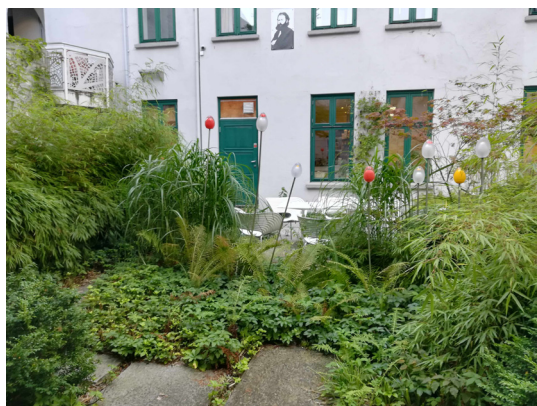
Jedno z podwórek w centrum miasta – miejsce na lunch i pogawędkę.

W mieście tym zachęca się obywateli do wspólnej pracy przy poszczególnych projektach oraz przy budowaniu wizji przyszłości, gdyż dzięki niej łatwiej o identyfikację z miejscem, gdzie się żyje. Na przykład władze zapraszają wszystkich mieszkańców do sali koncertowej i podczas warsztatów mówią o planowanych inwestycjach. Mieszkańcy wypisują swoje pomysły, które są