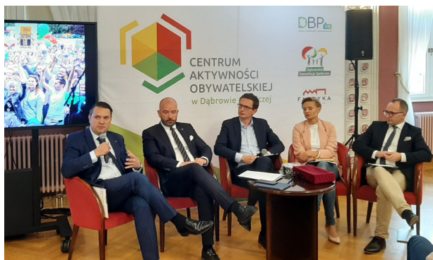
Uczestnicy debaty prezydenckiej.

Elementami reformy mają być między innymi szczegółowe przepisy regulujące wspieranie organizacji w formie nie tylko finansowej, ale i pozafinansowej oraz wprowadzenie zapisów wprost wskazujących na możliwość zawierania umów i realizacji przedsięwzięć na okres powyżej 5 lat (co może zapewnić większą stabilność organizacji, szczególnie tych działających w obszarze pomocy społecznej)