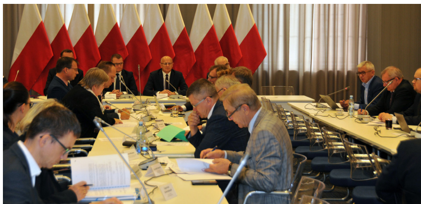
Samorządowcy nie mają wątpliwości, że koszty związane z podniesieniem płacy są źle wyliczone.

Następnym problemem będzie zrównanie płac młodych, rozpoczynających pracę osób z wyższym wykształceniem z pracownikami o wykształceniu podstawowym. Tu dodatkowym, ubocznym efektem może być zniechęcanie młodych ludzi do podnoszenia swoich kwalifikacji. Samorządowcy syją przykładami: nauczycieli w szkołach, którzy od 1 września będą zarabiali i to na trzecim stopniu awansu – 2486 zł, pielęgniarek, które zarobią tyle samo co osoby z personelu pomocniczego, a także pracowników pomocy społecznej, służb, inspekcji i straży, gdzie wynagrodzenia są bardzo niskie.