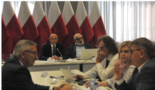
Samorządowcy chcą, by minister finansów jak najszybciej powołał specjalny rządowo-samorządowo-ekspertski zespół, który powinien podjąć intensywne prace nad nowym systemem finansów publicznych.

Jednym z szybkich działań, które może podjąć minister finansów jest np. zmniejszenie dla tej perspektywy finansowej wskaźnika udziału środków dotacyjnych w projektach