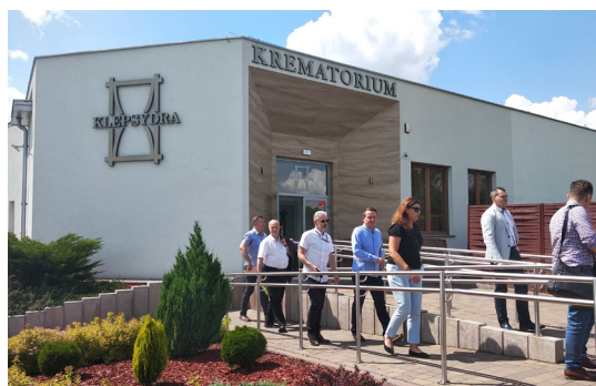
Uczestnicy wizyty studyjnej w nowym obiekcie w Podgórkach Tynieckich.

publiczno-prywatnego w trybie koncesji na terenach, które w planie zagospodarowania przestrzennego były przeznaczone na takiego rodzaju usługi. Przedmiotem koncesji była kompleksowa realizacja inwestycji w postaci zaprojektowania i wybudowania cmentarza w Podgórkach Tynieckich w Krakowie wraz z obiektem ceremonialnym, administracyjnym i spopieliarnią za wynagrodzeniem, które stanowi wyłączone prawo do czerpania pożytków z przedmiotu koncesji, tj. opłat pobieranych bezpośrednio od użytkowników.