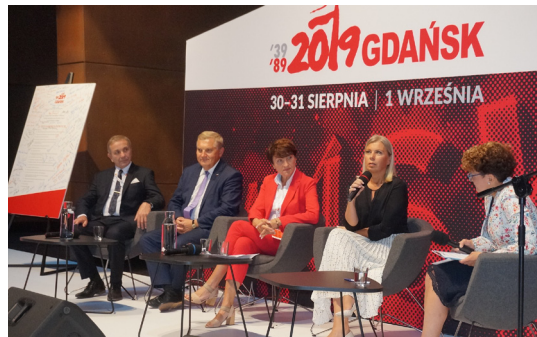
Uczestnicy debaty „Przyszłość samorządów”.

- W tej chwili jest to 100 mld euro. Żaden kraj unijny tyle nie ma. Za chwilę będzie to już mniej, ale nadal kilkadziesiąt mld euro - przypominała.