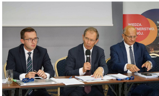
W dyskusji poprzedzającej podjęcie stanowiska samorządowcy z miast dzieliли się swoimi uwagami na temat zagrożeń dla funkcjonowania samorządów - padały stwierdzenia, że obecna sytuacja to zamach na samodzielność finansów.