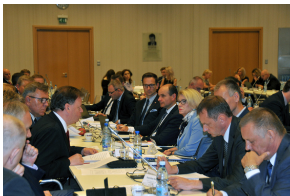
Obie strony umówiły się na kontynuację spotkań w celu porównania danych.

Prezes Frankiewicz zaznaczył, że niekorzystnych zmian jest więcej, jednak skupił się na najważniejszych. Dodał też, że wiele z nich wprowadzanych jest w trakcie roku budżetowego, co jest dodatkowym utrudnieniem dla JST, bo przecież budżety zostały zaplanowane wcześniej. Samorządowcy postulują w związku z tym, by rząd zrekompensował im ubytki w po-