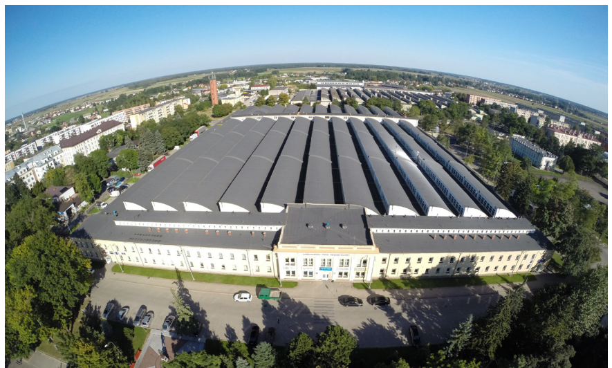
Zambrowski Park Przemysłowy.

Dzisiejszy Zambrow nie jest już uzależniony od jednego dużego zakładu pracy. Z biegiem lat przyciągnął licznych przedsiębiorców z różnych dziedzin, np. Mlekoop,