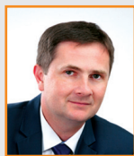
Krzysztof JAŹDŹYK Prezydent Skierniewic