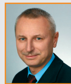
Ryszard BREJZA Prezydent Inowrocławia