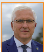
Władimir TYSZKIEWICZ Prezydent Nowej Soli