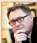
Zbigniew PODRAZA Prezydent Dąbrowy Górniczej