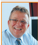
Janusz GROMEK Prezydent Kołobrzegu