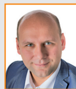
Szymon SZYNKOWSKI vel Sę Delegat miasta Poznania, Poseł na Sejm RP (członek Zarządu do 2017 roku)