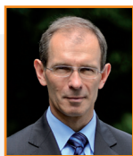
Zygmunt FRANKIEWICZ Prezes, Prezydent Gliwic