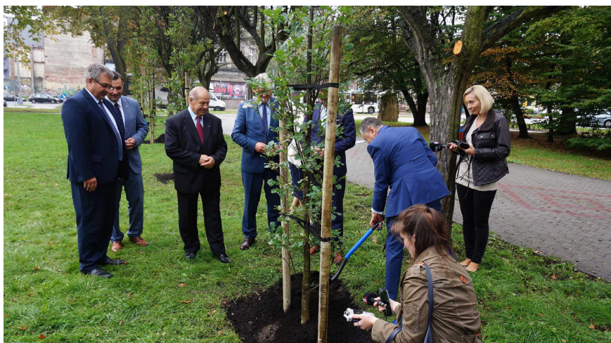
Przed spotkaniem Zarządu ZMP odbyła się uroczystość uhonorowania setnej rocznicy odzyskania przez Polskę niepodległości przez symboliczne sadzenie drzew w Parku Miejskim im. Franciszka Kachla w Bytomiu, a także wspólne posiedzenie Zarządów ZMP i Śląskiego Związku Gmin i Powiatów.

Organizacje i miasta zgłosiły wiele uwag (w tym bardzo praktycznych) do projektu Ordynacji podatkowej, które zostały