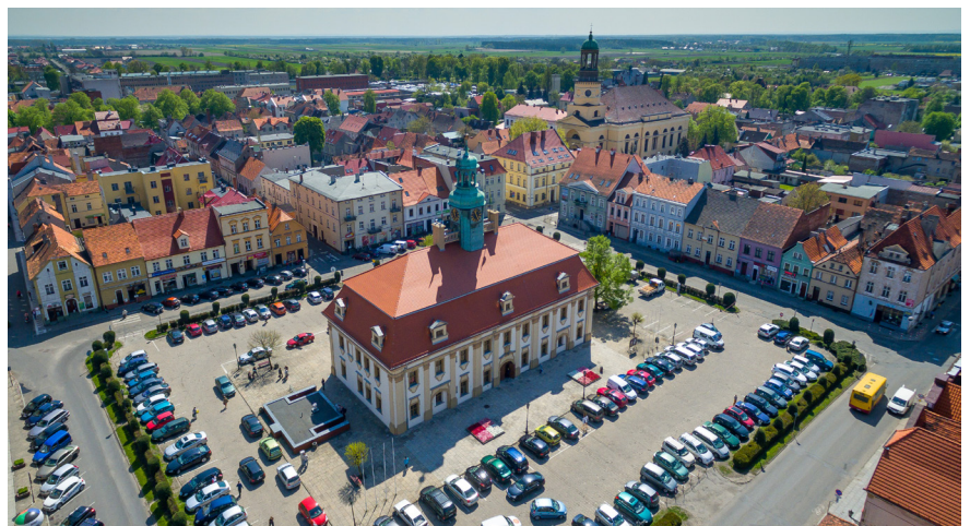
Rawicz - rynek z lotu ptaka.

wane m.in. przez rawickich muzyków zostały wpisane na Krajową Listę Niematerialnego Dziedzictwa Kulturowego UNESCO. Rawicz słynie ze znanych sportowców, dlatego nie mogło tu zabraknąć organizowanych z rozmachem imprez sportowych. Jedną z nich jest 24-godzinny Rawicki Festiwal Sportu - od 2011 roku największe przedsięwzięcie eventowe i jednocześnie jedyne tego typu w Polsce. Z trwającej całą dobę rywalizacji wyłaniani są zwycięzcy sztafetowego biegu sztafetowego zabytkowymi Plantami im. Jana Pawła II i innych dyscyplin. W roku 2018 w Festiwalu wzięła udział rekordowa