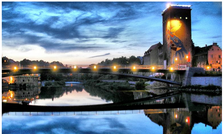
Most Staromiejski w Zgorzelcu.

W 1220 roku, dzięki akcji kolonizacyjnej Zgorzelec uzyskał prawa miejskie. W 1346 roku był jednym ze współzałożycieli Związku Sześciu Miast - konfederacji skupiającej królewskie miasta Górnych Łużyc. Szczyt potęgi miasta przypadł na II połowę XV i I połowę XVI wieku. Wzdłuż szlaku Via Regia, od Erfurtu do Wrocławia, nie było w tym czasie większego ośrodka miejskiego niż Zgorzelec. Dzisiejszą nazwę miasta uchwalono w 1946. Po II wojnie światowej osiedlono tu (oraz w Policach w woj. zachodniopomorskim) dużą kolonię greckich i macedońskich uchodźców (głównie komunistycznych partyzantów), którzy szukali schronienia w Polsce po greckiej wojnie domowej 1946-1948. Łącznie ich liczba sięgała 14 tysięcy osób.