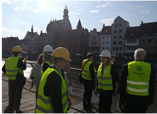
Uczestnicy wizyty studyjnej na Wyspie Spichrzów w Gdańsku.

W tym samym czasie kierownictwo firmy SON poszukiwało nieruchomości, na której firma mogłaby rozszerzyć swoją dotychczasową działalność, w warunkach dostosowanych do zmieniających się przepisów. Do tej pory jej działalność prowadzona była w różnych lokalizacjach na terenie powiatu, co generowało zwiększone koszty i utrudniało logistykę.