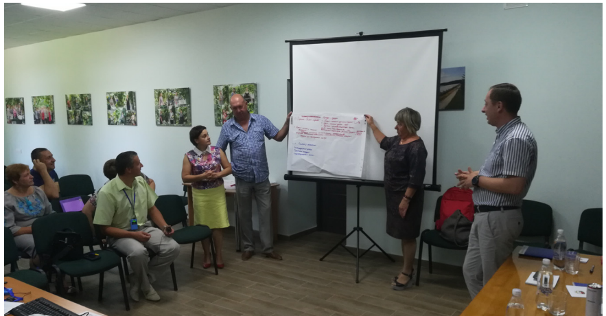
Uczestnicy spotkań po części teoretycznej i prezentacji polskich doświadczeń dokonywali analizowali sytuację w swoich gminach. Efekty pracy prezentują pracownicy Urzędu Gminy Stanisziwka.

w obszarach subregionalnych i koordynacja planowania strategicznego i przestrzennego, może wyznaczyć nową perspektywę integracji zarządzania rozwojem