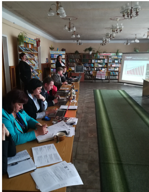
Doświadczeniami z zarządzania gminą miejsko-wiejską, z władzami ukraińskiej połączonej gminy Emilczyn, dzielili się samorządowcy z Grodziska Mazowieckiego.

miejskiej (Emilczyn) i 18 gmin wiejskich. W jej skład wchodzi 61 miejscowości, w których mieszka ok. 20,5 tys. osób. Gmi-