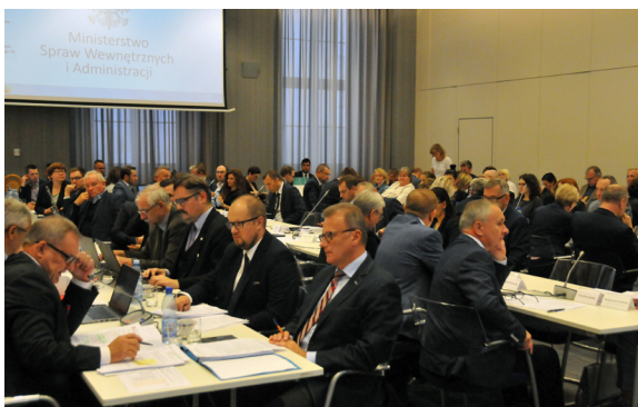
Samorządowcy pozytywnie zaopiniowali projekt Ministra Edukacji Narodowej dotyczący bezpieczeństwa i higieny pracy w szkołach, jednak po uwzględnieniu poprawki dotyczącej remontów.

Z kolei projekt Ministra Edukacji Narodowej dotyczący bezpieczeństwa i higieny pracy w szkołach samorządowcy zaopiniowali pozytywnie, jednak po uwzględnieniu poprawki dotyczącej remontów. Otóż rządowy projekt zabraniał prowadzenia w szkołach remontów, a nawet napraw i instalacji w trakcie roku szkolnego. Jak zauważyli samorządowcy – wszelkiego typu awarie czy zepsuty sprzęt musiałyby czekać aż do przerw wakacyjnych, nie mówiąc już o poważnych remontach szkół, które nie mogłyby się odbyć, bo trwają dłużej niż wakacje.