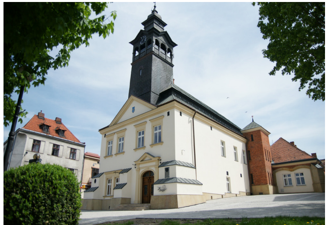
Ratusz w Przeworsku.

nej i gospodarczej. Dzięki korzystnemu położeniu, wówczas w województwie ruskim, miasto rozwijało się stosunkowo szybko, miało prawo odbywania targów i jarmarków oraz składowania wina. Już w początkach XV wieku powstały tu pierwsze organizacje cechowe. Przeworsk słynął z handlu i tkactwa. Dowodem czasów świetności są zachowane do dziś wspaniałe zabytki architektury sakralnej i świeckiej oraz pozostałości obwarowań miejskich.