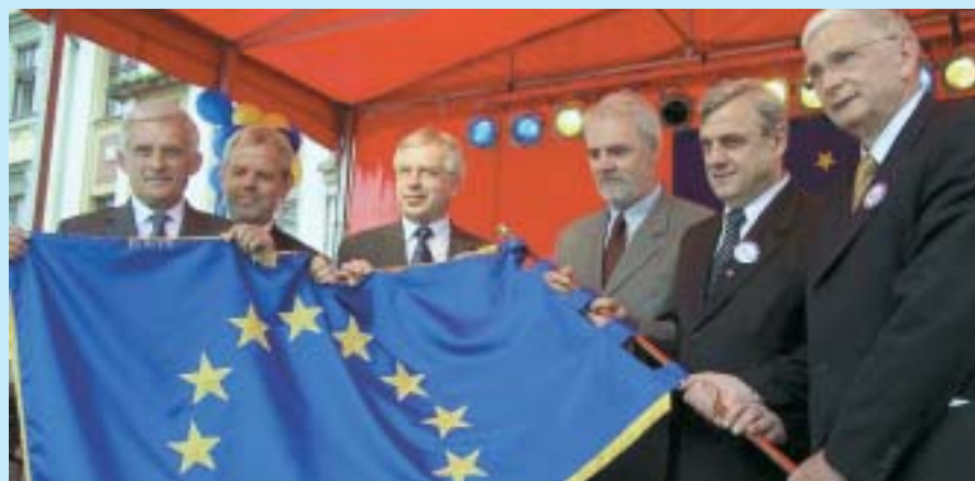
W czerwcu 2004 r. Rybnik otrzymał Honorową Flagę Rady Europy. Na zdjęciu uroczystość wręczenia trofeum.