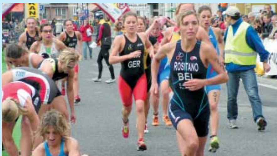
Puchar Europy w Triathlonie na ulicach Kędzierzyna-Koźla.

Kędzierzyn-Koźle i Lublin to dwa miasta członkowskie Związku Miast Polskich, które w tym roku nagrodzone zostały Honorową Flagą Rady Europy. Flaga to drugi po Dyplomie stopień wśród europejskich wyróżnień. W tym roku otrzymało ją 19 europejskich samorządów.