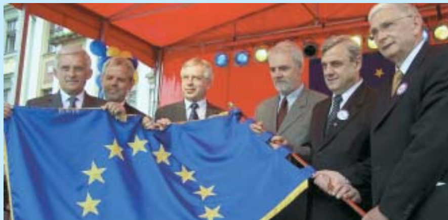
W czerwcu 2004 r. Rybnik otrzymał Honorową Flagę Rady Europy. Na zdjęciu uroczystość wręczenia trofeum.