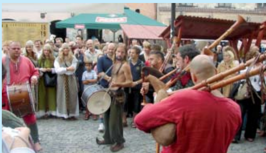
Występy folkowej grupy Holloenek Hungarica z Debreczyna na rynku Starego Miasta w Lublinie.

niem „Wspólne Korzenie” oraz władzami Krakowa, Warszawy i Częstochowy. Zakłada organizowanie wizyt w Polsce potomków Polaków zesłanych na Syberię. Z kolei inicjatywa pod nazwą Biblio-