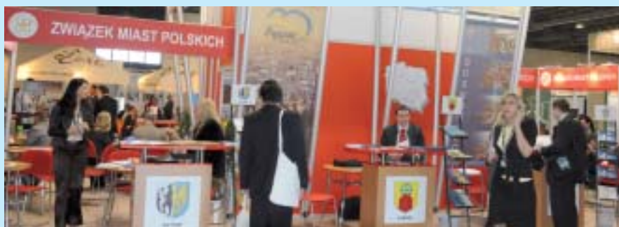
Stoisko Związku Miast Polskich na targach CEPIF 2008.

dziej przyciąga uwagę odwiedzających niż samodzielne, małe stoisko pojedynczego miasta. Niektóre, zazwyczaj duże miasta wolą prezentować się samo-