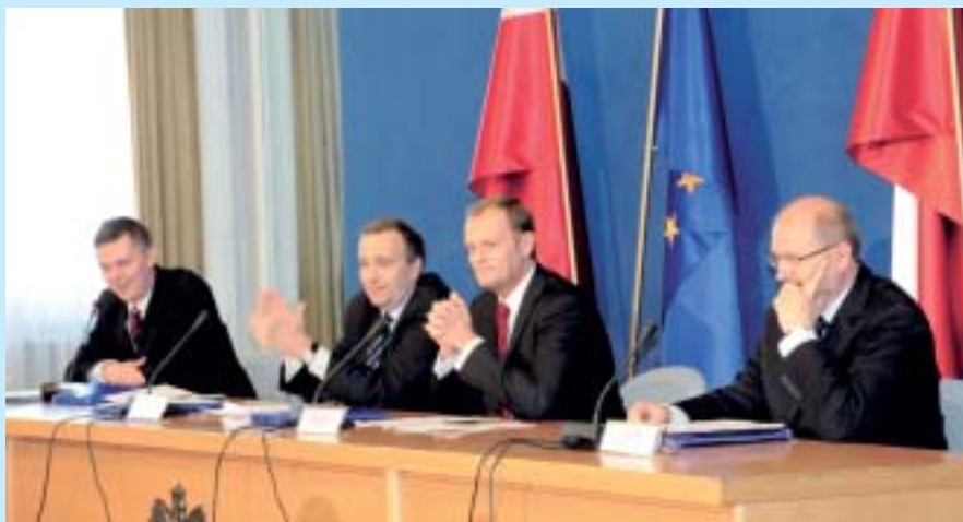
Po raz drugi już w obecnej kadencji premier polskiego rządu uczestniczył w posiedzeniu Komisji Wspólnej.