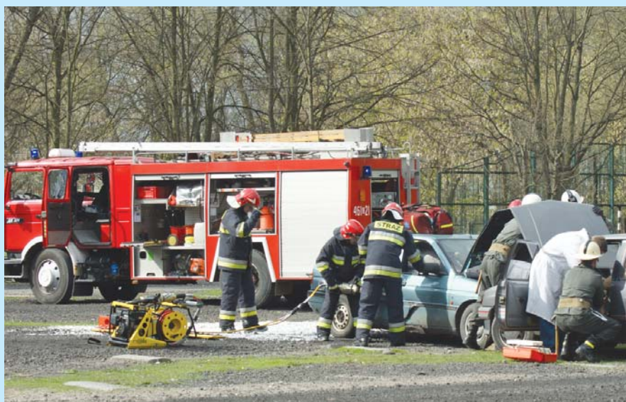
Praktyczny pokaz ratownictwa.