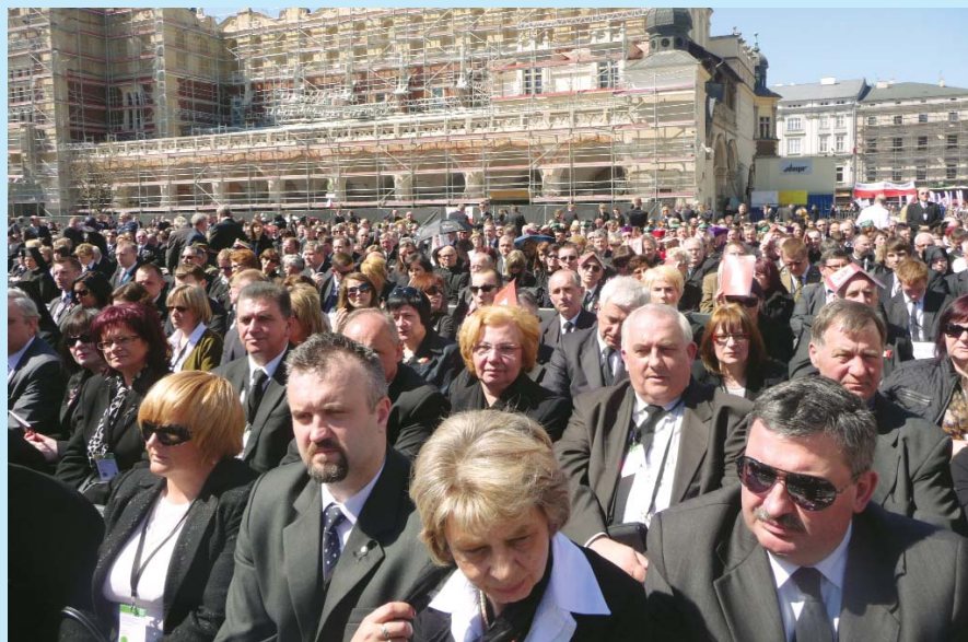
Przedstawiciele polskich miast na Rynku Głównym w Krakowie podczas uroczystości pogrzebowych Lecha i Marii Kaczyńskich.

Związek Miast Polskich zorganizował wspólny udział przedstawicieli miast w uroczystościach pogrzebowych. Na zaproszenie Związku odpowiedziały następujące miasta: Bogatynia, Bolesławiec, Brusy, Czeladź, Częstochowa, Działdowo, Elk, Gdańsk, Gdynia, Giżycko, Głogów, Głowno, Gołdap, Gorzów Wielkopolski, Iłża, Jasło, Jaworzno, Katowice, Kłodawa, Kochanowice, Koło, Kraków, Kutno, Kutno, Kwidzyn, Lublin, Łosice, Łowicz, Mielec, Mszana Dolna, Myślenice, Nowa Dęba, Nowa Sól, Nowy Sącz, Nysa, Opatów, Opole, Opole Lubelskie, Oświęcim, Piekary