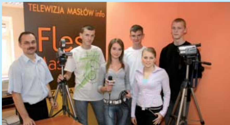
Gminna Telewizja Internetowa „Masłów Info” to inicjatywa młodych ludzi (14–17 lat).

Prezentacja kultury ludowej w Internecie to niewątpliwa innowacja, która przyczynia się do podtrzymania społecznej roli kultury ludowej, również wśród młodzieży. ■