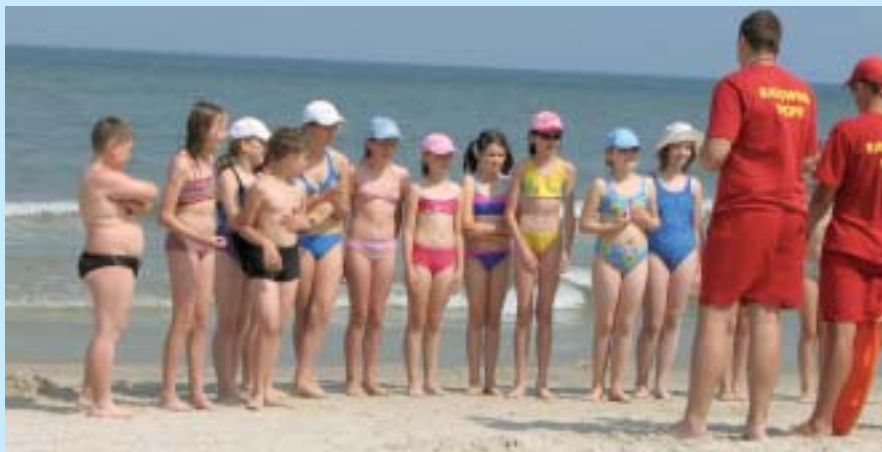
Dzieci limanowskie nad morzem.

Każda gmina pokrywa swoje koszty, w praktyce szkoła z jednej gminy jest przyjmowana przez szkołę w drugiej. W latach 2003–2007 z letniego wypoczynku zorganizowanego przez gminę skorzystało 1250 uczniów. Brak pośredników w postaci firm komercyjnych sprawia, że jest to najtańsza zorganizowana forma wypoczynku dla najmłodszych członków gminnej społeczności. Rocznie kosztuje samorząd 120 tys. zł. Projekt zapewnia też efektywne wykorzystanie kadry nauczycielskiej i administracyjnej w okresie letnim. ■