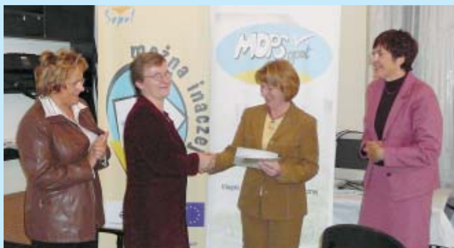
Od lutego do czerwca 2007 r. w Sopocie przeszkolono kolejne osoby do pracy w charakterze asystenta rodziny w projekcie „Można inaczej”. Na zdjęciu wręczenie certyfikatów asystentkom rodziny.

poszerzenie wiedzy o łączących ich członków problemach odnajdują sposób na pokonanie trudnych sytuacji i kryzysów w rodzinie. Powstanie grup poprzedza trening edukacyjno-informacyjny. Później grupy biorą udział w kilkudniowych wyjazdach do atrakcyjnych turystycznie miejsc, gdzie panują optymalne warunki do nawiązania wspólnych relacji, wzmocnienia więzi między członkami.