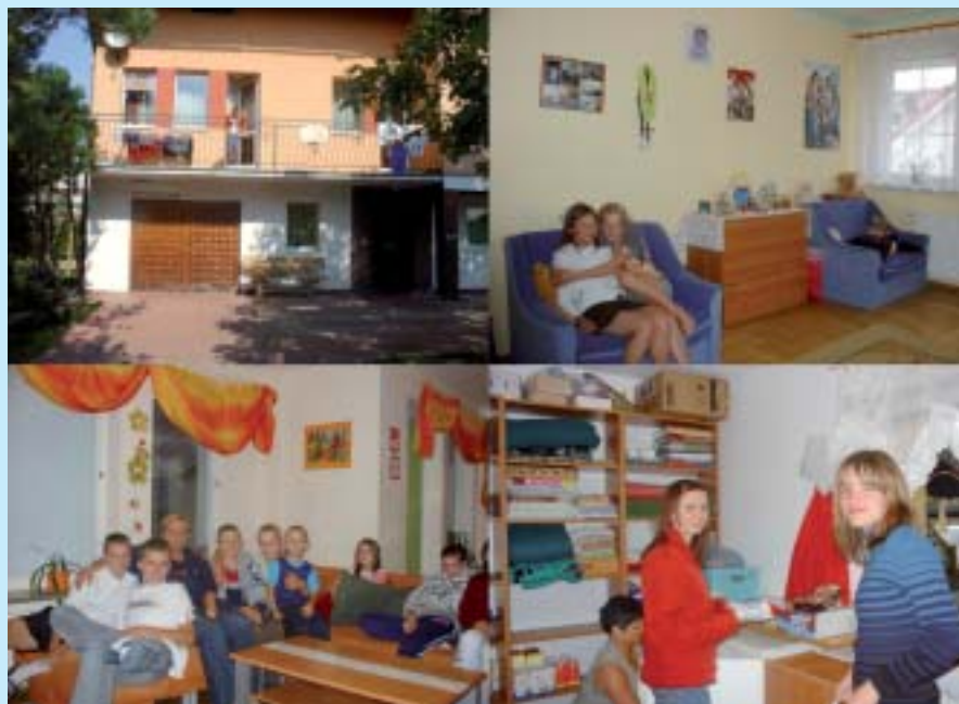
W powiecie słupskim Domy Dziecka przekształcono w nowoczesną instytucję opiekuńczą. Nowy system prowadzenia placówki bardziej przypomina środowisko rodzinne.