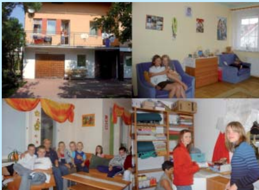
W powiecie słupskim Domy Dziecka przekształcono w nowoczesną instytucję opiekuńczą. Nowy system prowadzenia placówki bardziej przypomina środowisko rodzinne.