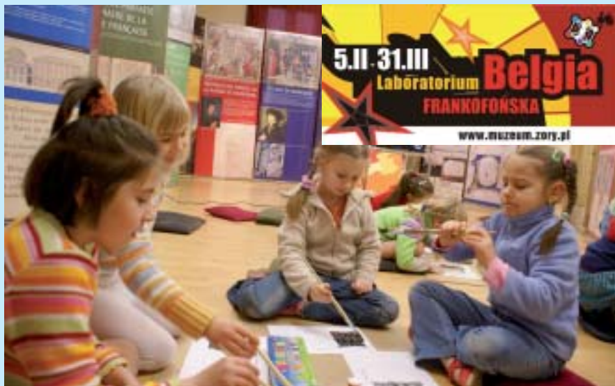
W projekcie „Laboratorium – Belgia frankońska” realizowanym przez Muzeum Miejskie w Żorach wzięło udział 1 541 uczestników.

Projekty kulturoznawczo-edukacyjne, których średni koszt realizacji wynosi 15 tys. zł, okazały się doskonałym rozwiązaniem przyciągającym odbiorcę. Dzięki cyklom tematycznych prezentacji związanych z okresowymi wystawami znacznie zwiększono atrakcyjność muzeum, co przyniosło duże zainteresowanie społeczne, zwłaszcza wśród młodzieży szkolnej. ■