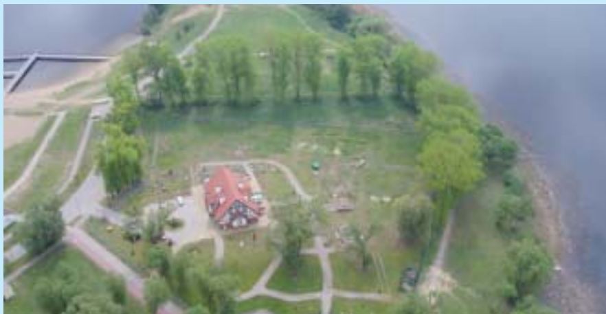
Centrum Edukacji Ekologicznej w Elku.

Ten wyjątkowy w województwie warmińsko-mazurskim ośrodek posiada dobrze wyposażoną bazę, na którą składają się: trzy sale ze sprzętem multimedialnym, stanowiska komputerowe z dostępem do Internetu, sprzęt do obserwacji mikro- i stereoskopowych, walzkowe