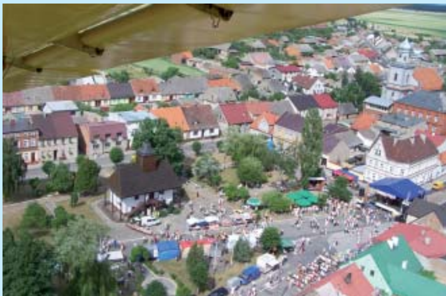
Sulmierzyce z lotu ptaka.

w większości prowadzą produkcję wielokierunkową, co uwarunkowane jest tym, że większość z nich ma niewielką powierzchnię – poniżej 10 ha. Przemysł na terenie miasta reprezentuje zakład Spółdzielni Produkcyjno-Handlowej „EWA” produkujący słodycze. Ogółem zarejestrowanych jest tu 138 podmiotów gospodarczych.