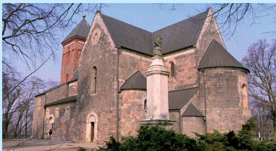
Kolegiata pw. śś. Piotra i Pawła.

Na terenie miasta działa wiele klubów sportowych – piłkarski, wioślarski, żeglarski, koszykówki oraz towarzystwo gimnastyczne – a także grupy muzyczne, taneczne i warsztaty plastyczne przy Centrum Kultury „Ziemowit”. Od 1978 r. istnieje także Nadgoplański Zespół Folklorystyczny. ■