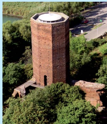
Mysia Wieża z ruinami zamku.

Innym zabytkowym miejscem w Kruszwicy jest Kolegiata p.w. śś. Piotra i Pawła, z zabytkowymi chrzcielnicami z XI i XII w., późnogotyckimi rzeźbami z XVI w. oraz XVII-wiecznymi marmurowymi płytami poświęconymi początkom kościoła i pierwszym biskupom. Kolegia-