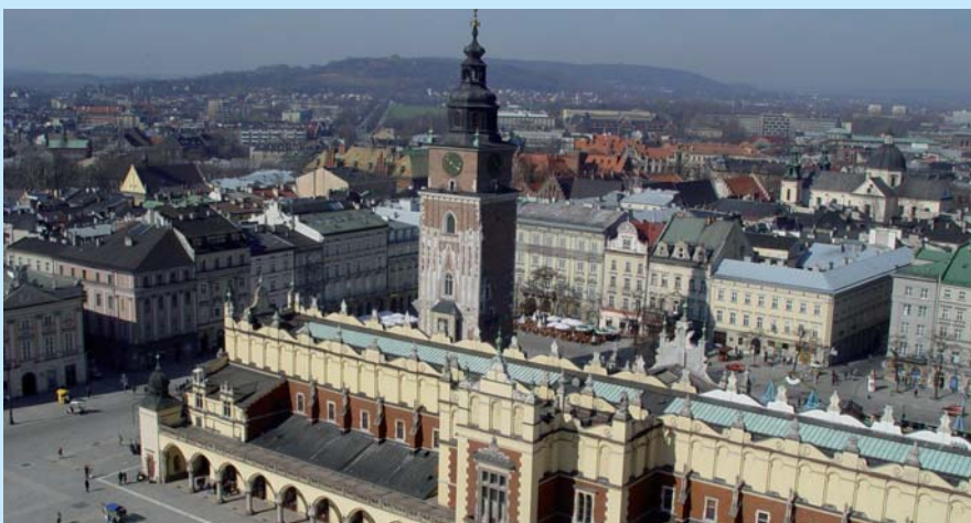
Rynek Główny (widok z wieży Kościoła Mariackiego).

Kulminacja obchodów nastąpi w czerwcu i wtedy odbędą się m.in.: Wielka Parada Smoków – widowisko plenerowe na Wiśle, łączące muzykę i światło, z wykorzystaniem efektów pirotechnicznych i kurtyn wodnych z olbrzymimi pływającymi oraz fruwającymi smokami w roli głównej. Będzie też impreza balonowa pt. „Niebo Otwartej Europy – Puchar Unii Europejskiej”, będzie Pochód Królów – inscenizacja do muzyki J.K. Pawлуśkiewicza czy Krakowska Noc Teatrów: prezentacje spektakli krakowskich teatrów połączone ze zwiedzaniem niedostępnych na co dzień miejsc w budynkach teatrów. Obchody zainauguruje kantata duetu Rubik – Książek „Zakochani w Krakowie”, zaś zakończy symfonia na dzwony autorstwa Marka Stachowskiego z wykorzystaniem 25 dzwonów z krakowskich kościołów.