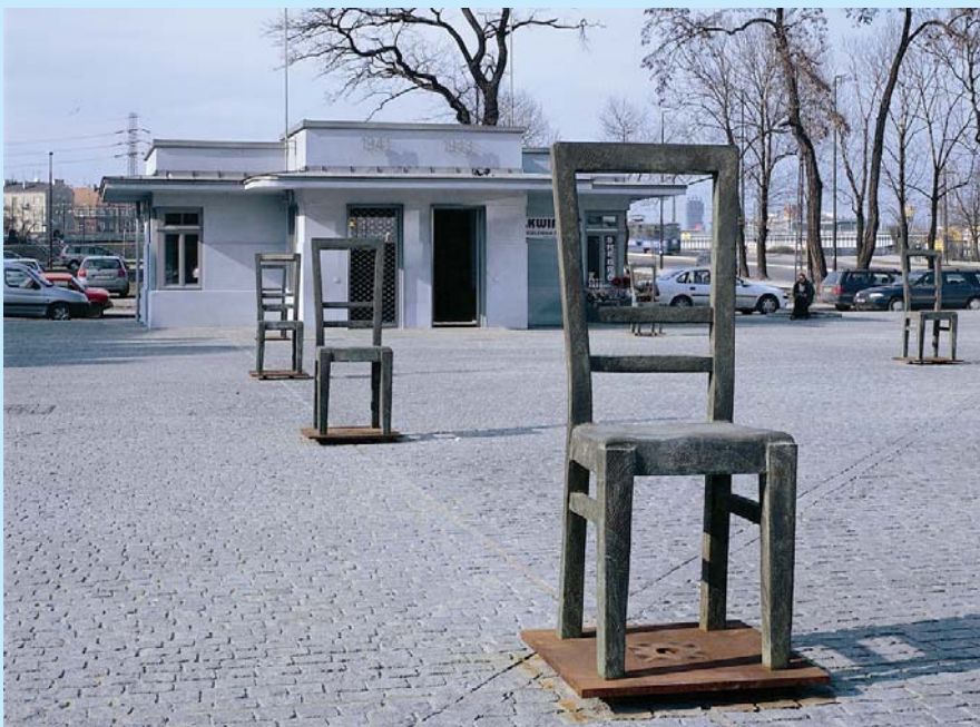
Nagrodzony projekt „Nowy Plac Zgody w Krakowie”. Puste krzesła – w ten sposób uczczono pamięć po nieobecnych.

W 2006 r. Europejską Nagrodę za najlepszą miejską przestrzeń publiczną ( European Prize for Urban Public Space ) dostało 5 projektów, w tym Biuro Projektów Lewicki Łatak za realizację nowego placu Zgody w Krakowie. To miejsce, poświęcone pamięci Żydów, jest swego rodzaju pomnikiem, choć pełni funkcję użytkową dla mieszkańców. Dzięki zastosowaniu specjalnych mebli miejskich, konstrukcji przystanków czy budowie dworca – sali pamięci, stanowi przejmujący symbol holocau-