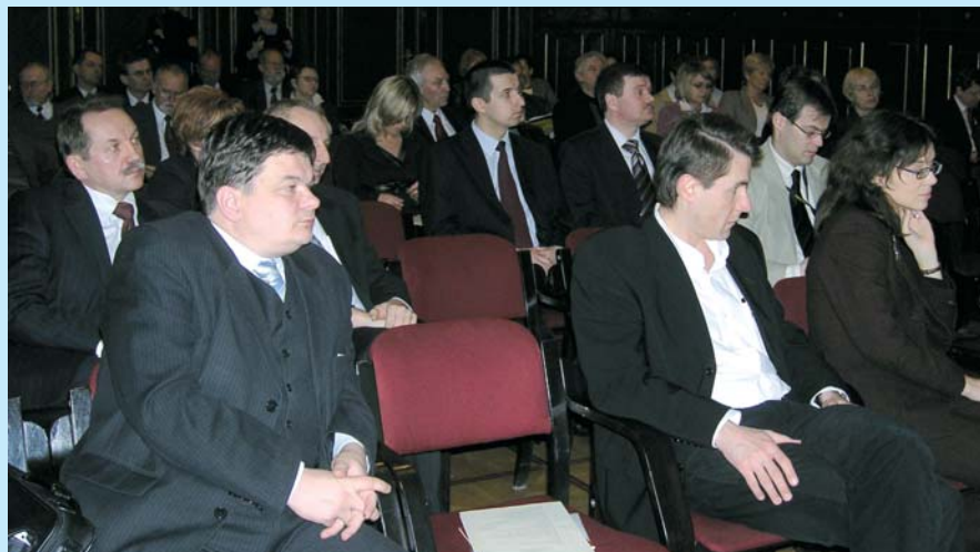
Nagrody mobilizują miasta do działania – podkreślali uczestnicy konferencji.

Częstochowę nagrodzono za wzorową współpracę z miastami maryjnymi – Lourdes we Francji i Loreto we Włoszech – dotycząca