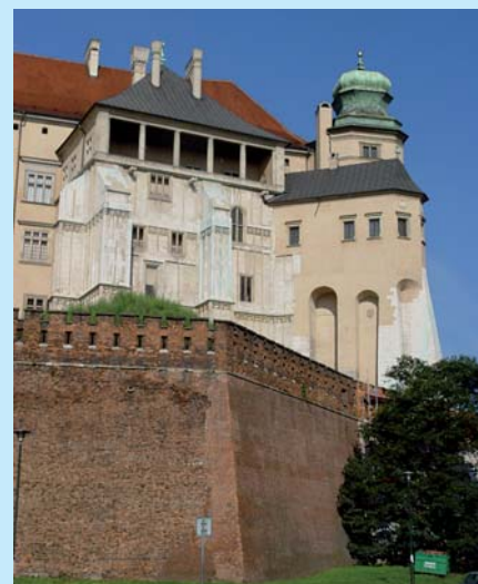
Katedra na Wawelu.

ło już swoją historię i znaczenie. Właśnie z niepowtarzalnym dziedzictwem kulturowym wiąże się wyjątkowość Krakowa. Tutaj na Wzgórzu Wawelskim wybudowano rezydencję polskich królów, a zarazem miejsce ich koronacji i nekropolię. Od XI do XVII w. Kraków był bowiem stolicą Polski. Tutaj w 1364 r. po-