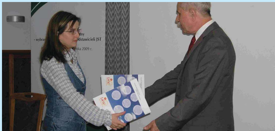
Wzajemne przekazywanie dokumentów podczas oficjalnych wizyt – zawsze z prawej ręki do lewej, aby móc potem wymienić uścisk dłoni.