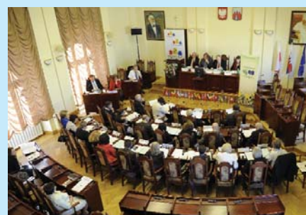
Posiedzenie Komisji Kultury i Edukacji CLRAE w Bydgoszczy.

W drugim dniu spotkania odbyło się międzynarodowe seminarium „Zróżnicowane miasta, kreatywne miasta”. Znaczną jego część poświęcono była doświadczeniom Bydgoszczy. Zaprezentowane zostały cztery instytucje: Fundacja YAKIZA (wykład na temat wpływów ży-