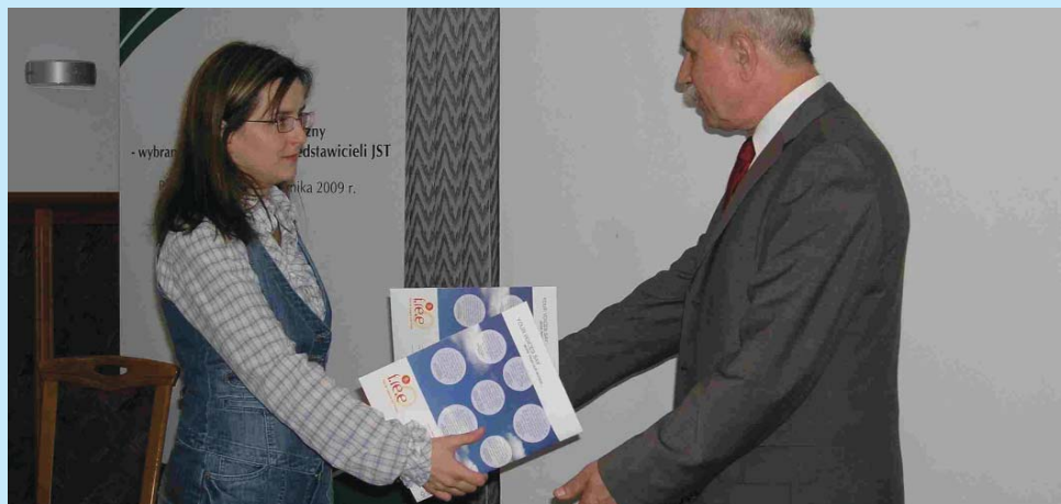
Wzajemne przekazywanie dokumentów podczas oficjalnych wizyt – zawsze z prawej ręki do lewej, aby móc potem wymienić uścisk dłoni.