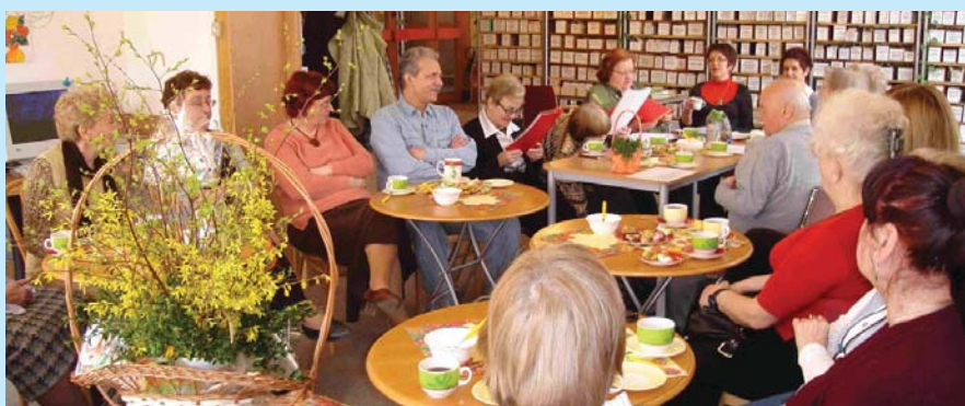
Podczas cyklicznych spotkań w koszalińskiej bibliotece osobom niewidomym i niedowidzącym prezentowane są nowości – „książki mówione” i audiobooki.

Dzięki podjętym działaniom osoby niepełnosprawne są włączone w nurt życia kulturalnego miasta. Podczas cyklicznych spotkań osobom niewidomym i niedowidzącym prezentowane są nowości – „książki mówione” i audiobooki, przygotowywane są bestsellery, prezentacje literatury różnych krajów w ramach akcji „Smaki świata”. Dla dzieci i dorosłych niepełnosprawnych intelektualnie prowadzone są cykliczne zajęcia biblioterapii. Osoby niepełnosprawne intelektualnie uczest-