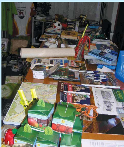
Spotkaniu Biur Promocji towarzyszył już tradycyjnie Przegląd Materiałów Promocyjnych miast.

mieszczeniu gości przy stole obowiązują zasadą prawej ręki. Gość honorowy zgodnie z zasadami precedencji zajmuje miejsce najbardziej eksponowane. Mężczyźni siadają zawsze obok kobiet, małżeństwa jednak nie zajmują miejsc koło siebie, a sąsiadami może być dwóch mężczyzn, nigdy zaś dwie kobiety. Ważną zasadą jest zatrudnienie na każde 6-8 osób jednego kelnera oraz obsłużenie gospodarza na końcu, choć jest on nawet prezydentem miasta.