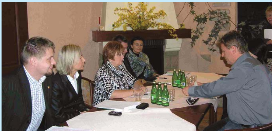
Zwycięski zespół w pełni profesjonalnie zorganizował wizytę potencjalnego inwestora z Niemiec.

Przystępując do organizacji przyjęcia, gospodarz powinien odpowiedzieć sobie na kilka podstawowych pytań dotyczących formy przyjęcia, czasu, kto będzie gościem honorowym, menu, podziału ról i obowiązków wśród pracowników, rozmieszczenia gości oraz terminu czy formy zaproszeń. Przyjęcie biznesowe stanowi często dalszą pracę, dlatego każdy z zaproszonych urzędników powinien być zobowiązany do napisania swojego sprawozdania ze spotkania. Warto wiedzieć, że powitaniem gości przed budynkiem urzędu powinien zająć się specjalnie do tego wyznaczony pracownik, który wprowadzi gości do gabinetu burmistrza. Przy roz-