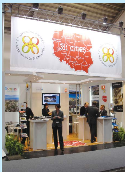
Stoisko Związku Miast Polskich na Targach w Monachium.

Podczas Targów przedstawiciele miast odbywali liczne spotkania, a także skorzystali z oferty konferencji i seminariów, w których