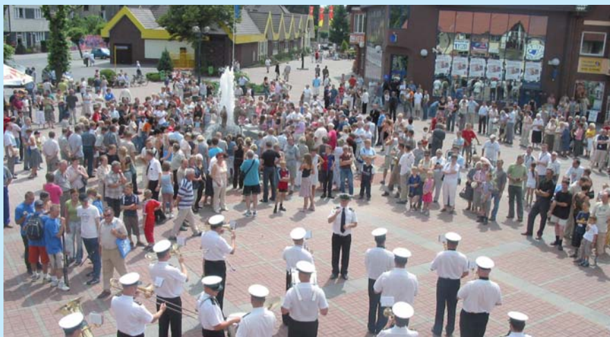
Dzisiejsze nowe centrum miasta tętni życiem.