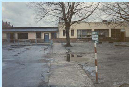
Centrum Czerska, lata 90. XX wieku. Rejon ulic Kościuski i Rynkowej – tereny dawnego targowiska miejskiego.

Plac Józefa Ostrowskiego – bo to on stanowi teraz centralny punkt Czerska – zajmuje powierzchnię 3600 m 2 . W na środku placu znajduje się fontanna, której architektura nawiązuje do znanych w całej Polsce „czerskich prastągów”. W specjalnych kwietnikach oraz