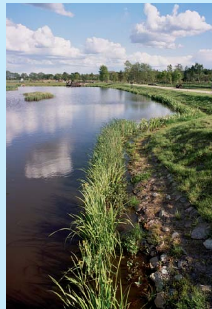
W ramach prac rewitalizacyjnych na podmokłych terenach przyszłego parku wybudowano układ urządzeń odwadniających. Brzegi stawów umocniono matą wegetacyjną.

Wartość wykonanych prac wynosi 8 mln zł. Środki na realizację tego przedsięwzięcia po-