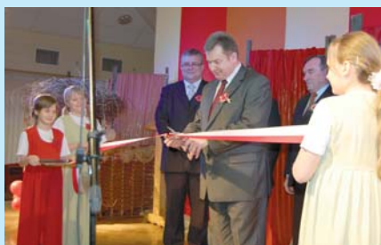
Uroczystość otwarcia Centrum Kultury.

Przyczyną wybudowania tak wspaniałego Centrum Kultury był rozwijający się z coraz większym impetem kleczewski amatorski ruch artystyczny. Ponad trzydzieści lat wcześniej po-