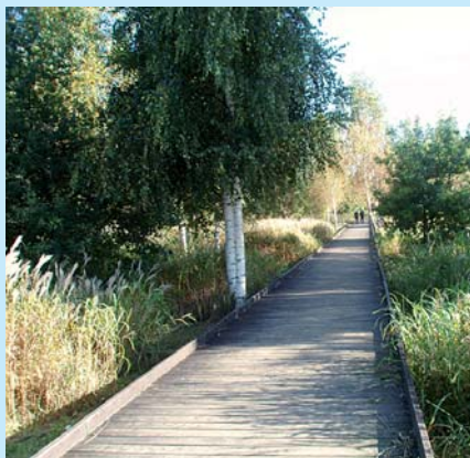
Kolekcja traw ozdobnych oglądana ze wzniesionych pomostów.

Zbudowano 5 kilometrów sieci komunikacji wewnętrznej dla pieszych i rowerzystów o nawierzchni żwirowej oraz utwardzono 4 kilometry tras pieszo-rowerowych o znaczeniu ogólnomiejskim. Tereny rekreacyjne wyposażono w elementy małej architektury parkowej, takie jak pomosty widokowe, miejsca grillowania, miejsca biesiad rodzinnych. Zainstalowano me-