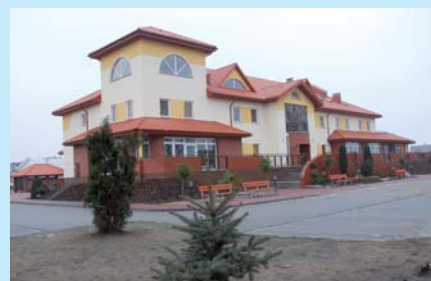
Budynek nowego Centrum Kultury w Kleczewie.

wstała stara siedziba „przitulona” do budynku OSP i ciasno zrobiło się ambitnym animatorom kultury, tym bardziej że ochoczo rozgościły się w gminie imprezy ponadlokalne. Centrum Kultury w obecnym kształcie znakomicie wpisuje się w architekturę nowej części miasta i już teraz jest wizytówką Kleczewa.