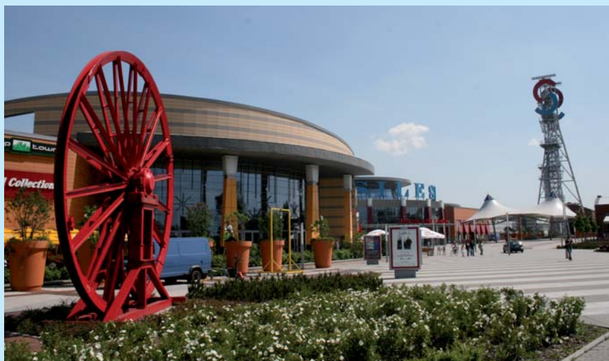
Silesia City Center wkomponowało się w krajobraz i klimat miejsca.