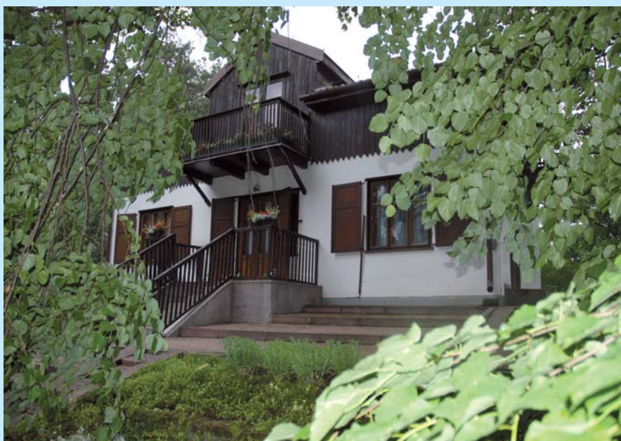
Muzeum im. Zofii i Wacława Natkowskich w Wołominie.

Po wojnie, w roku 1952 Wołomin stał się miastem powiatowym, co znacznie przyspieszyło jego dalszy rozwój. Powstały zakłady stolarstwa budowlanego „Wo-