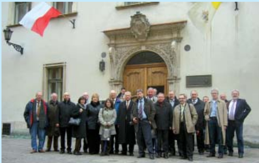
Członkowie Polsko-Niemieckiej Grupy Roboczej przed Centrum Jana Pawła II.

Urzędujący od 1 kwietnia br. dyrektor PNWM podkreślał przychylność rządów