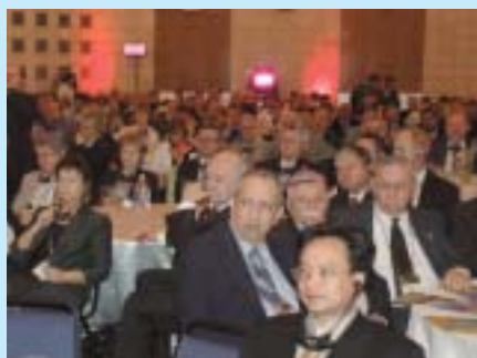
W kilkunastu dniowej konferencji wzięli udział prezydent Izraela, Szymon Peres i premier Izraela, Ehud Olmert.

W czasie konferencji nie mogło również zabraknąć wizyt w najważniejszych miejscach kultu religijnego chrześcijan, Żydów i muzułmanów: w Betlejem, w starej Jerozolimie, pod tzw. ścianą płaczu, w Galilei, Nazaret,