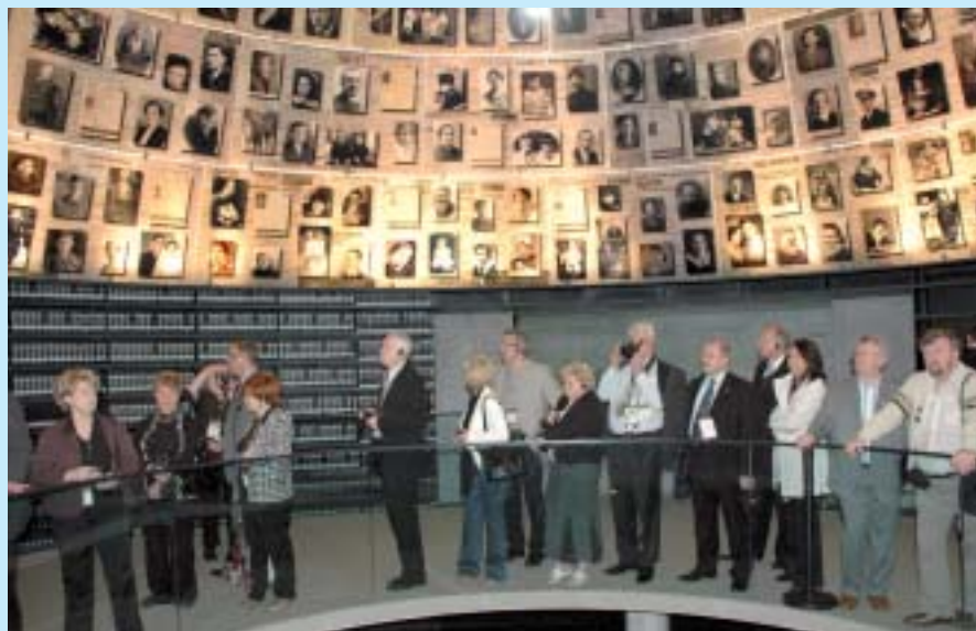
Wizyta polskiej delegacji w Nowym Muzeum Pamięci Holocaustu, Yad Vashem.