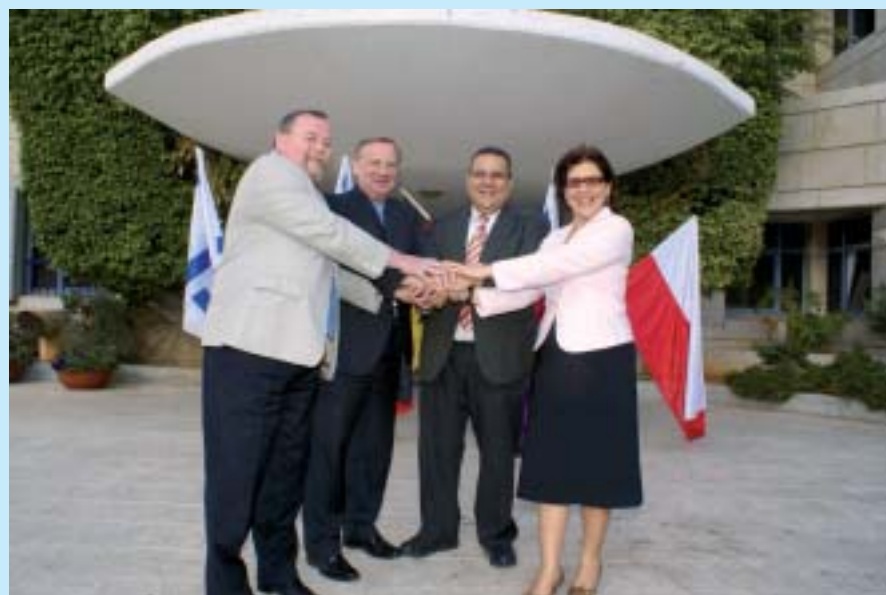
Burmistrzowie miast Gołdap, Dubna, Givat Shmuel i Stade.

nad jeziorem Genezarret i na Wzgórzach Golan. Szczególnym punktem pobytu w Izraelu było zwiedzanie Nowego Muzeum Pamięci Holocaustu, Yad Vashem połączone z ceremonią składania wieńców dla upamiętnienia Żydów pomordowanych podczas ostatniej wojny światowej oraz symboliczne sadzenie drzewek w Lesie Miast Partnerskich.