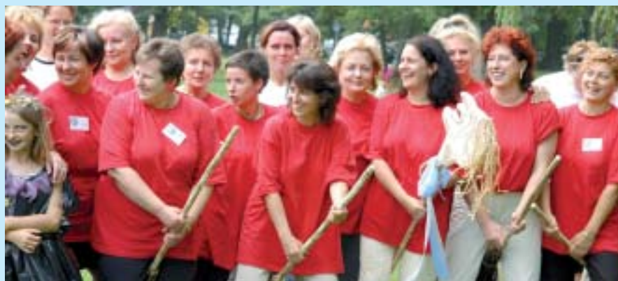
Złot dobrych czarownic na Mazurach, czyli Eurosabat w Giżycku.

VI Eurosabat odbędzie się podczas „Dni Giżycka”, 24 maja. (EPE)