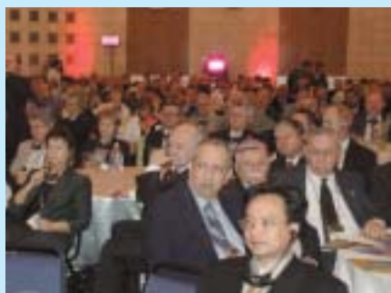
W kilkundniowej konferencji wzięli udział prezydent Izraela, Szymon Peres i premier Izraela, Ehud Olmert.

W czasie konferencji nie mogło również zabraknąć wizyt w najważniejszych miejscach kultu religijnego chrześcijan, Żydów i muzułmanów: w Betlejem, w starej Jerozolimie, pod tzw. ścianą płaczu, w Galilei, Nazaret,