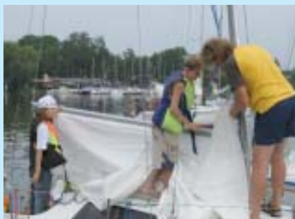
Polsko-litewski obóz żeglarski z równym udziałem dziewcząt i chłopców (projekt unijny realizowany w sierpniu 2007 r.).

Ogłaszane przez miasto konkursy grantowe na organizację przedsięwzięć „równościowych”