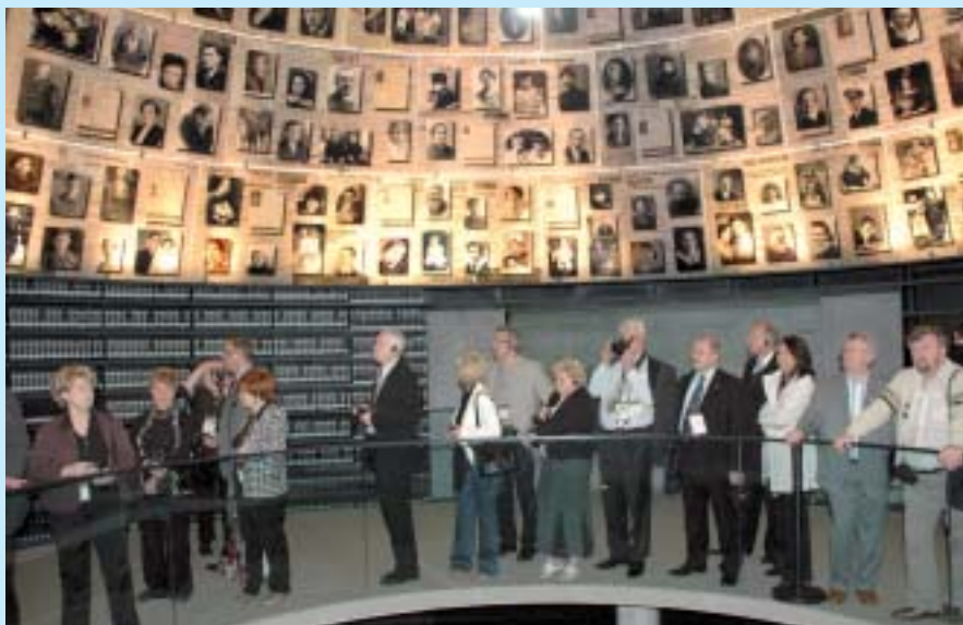
Wizyta polskiej delegacji w Nowym Muzeum Pamięci Holocaustu, Yad Vashem.