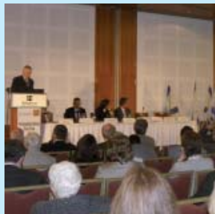
Podczas towarzyszących konferencji warsztatów na temat budowania atrakcyjności i konkurencyjności miasta zaprezentowała się Częstochowa.