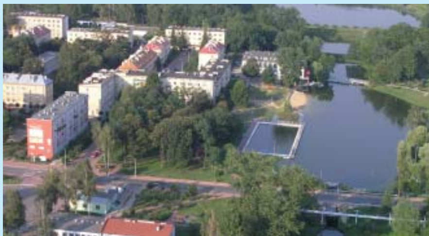
Poniatowa z lotu ptaka.