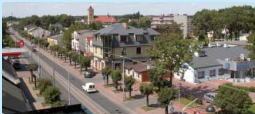
Widok na centrum miasta.