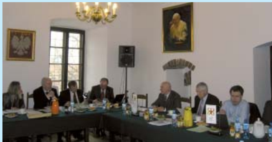
Podczas posiedzenia w Sandomierzu zdecydowano, że przedstawiciele Zarządu włączą się do prac związanych z ustawą metropolitalną.

zostały skierowane do Zarządu Związku. Jako stanowiska Zarządu postanowiono przyjąć wnioski w następujących sprawach: