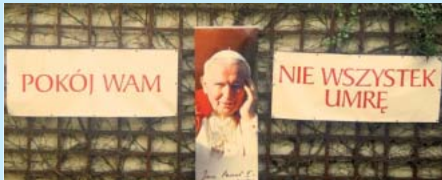
Dziedziniec Centrum Jana Pawła II w Krakowie, 3. rocznica śmierci Papieża Polaka.

Prof. Kotlarska-Michalska zaprezentowała także wyniki badań dotyczących diagnozy problemów rodziny i identyfikowanych przez badanych błędów wychowawczych. Wynika z nich, że ok. 80 proc. rodzin uznać można za funkcjonujące poprawnie. Pozostałe wykazują różne