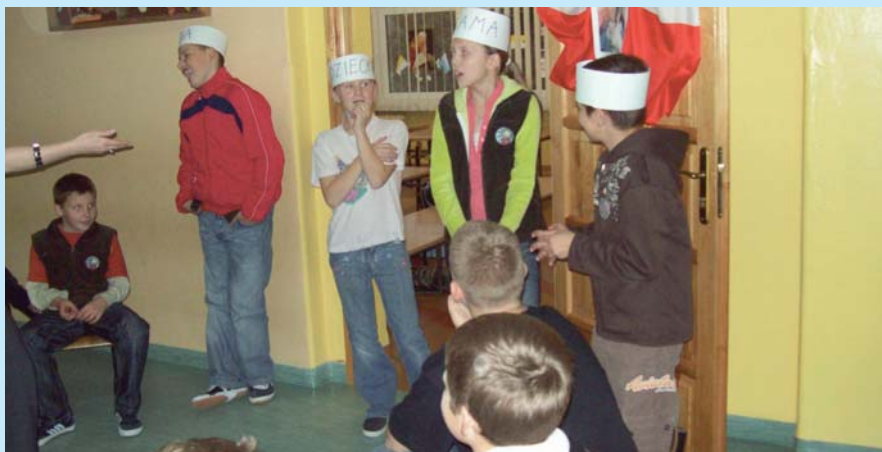
Trening Praktyczny – inscenizacja scenki „Rodzina alkoholowa od środka”.

Program „Odnaleźć się w sobie” obejmuje 3 obszary działań. Po pierwsze wspiera szkoły poprzez szkolenie nauczycieli, profilaktyczne programy, świetlice socjoterapeutyczne, zatrudnienie psychologów w placówkach, monitoring wizyjny czy warsztaty dla uczniów (prawie 30 tysięcy godzin zajęć). Po drugie – tworzy system pomocy specjalistycznej dla rodzin poprzez m.in. wprowadzenie tzw. Sobót zaufania (stałe konsultacje i porady psychologów) i komórek zajmujących się diagnozowaniem