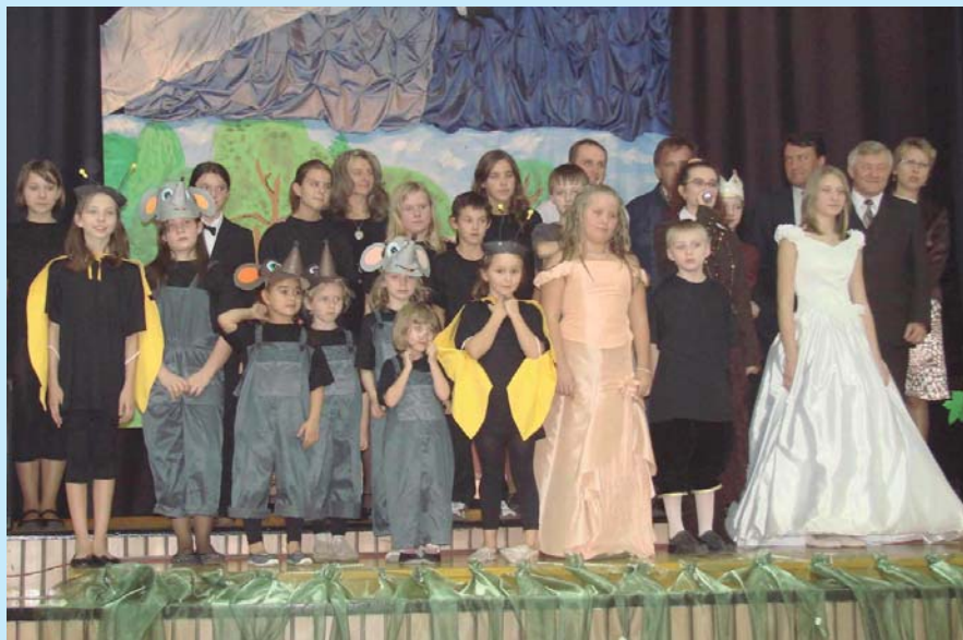
Jeden ze zrealizowanych projektów – „Bajka tańcem malowana”.

Dzięki konsekwentnej realizacji całego przedsięwzięcia poprawiła się komunikacja społeczna, przejrzystość w działaniach instytucji kultury, a także współpraca z organizacjami pozarządowymi i społecznymi. Powstanie grup nieformalnych i nowych NGO pozwoliło na zwiększenie liczby usług kulturalnych dla mieszkańców gminy. W latach 2004–2009 zrealizowano ponad 20 projektów, napisano 2 wnioski o środki unijne z EFS oraz wiele do funduszy krajowych, powstały 2 nowe stowarzyszenia, 2 grupy nieformalne twórców, zorganizowano konkurs gminny dla Koła Gospodyń Wiejskich „Partnerstwo na rzecz kultury gminy Psary”.