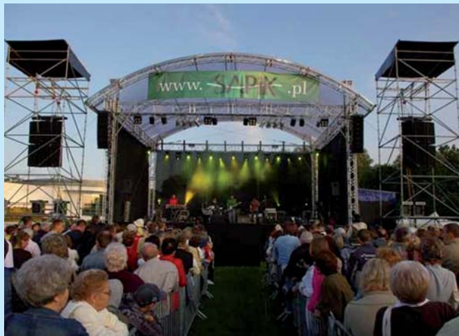
Koncert K.A.S.A i Golec uOrkiestra w Szczecinku.

Innowacyjność projektu polega m.in. na tym, że SAPIK oprócz promocji kulturalnej zajmuje się również szeroko rozumianym marketingiem terytorialnym, promocją gospodarczą,