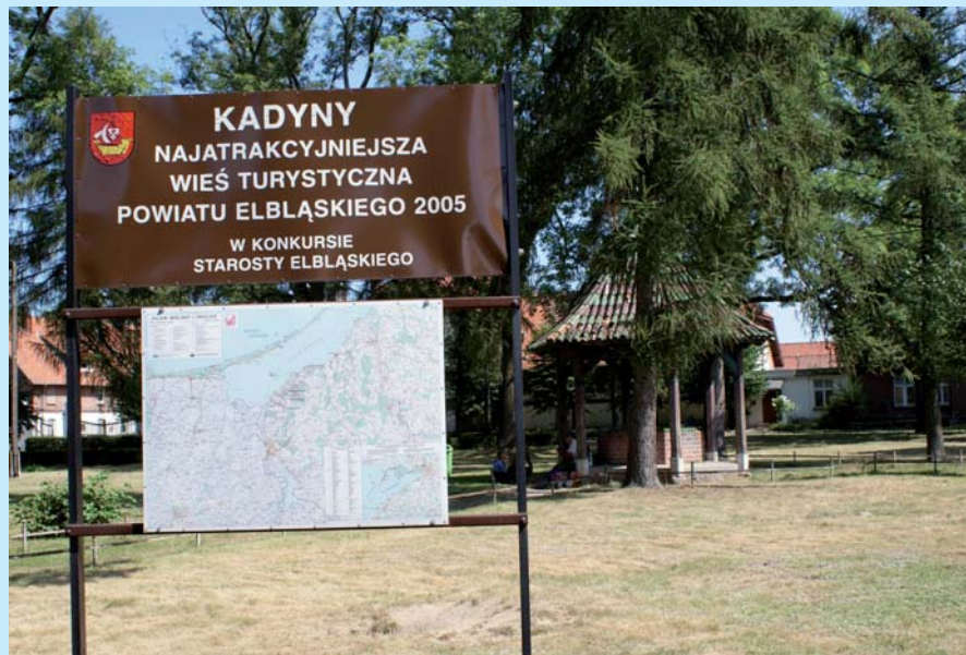
Tablica informująca o zwycięstwie w konkursie w centrum Kadyn.

Konkurs wywołał w środowiskach wiejskich niespotykaną do tej pory aktywność. Po pierwszej edycji żywiołowo zaczęły powstawać organizacje pozarządowe działające na rzecz lokalnych wspólnot. Obecnie jest ich już 45. Realizacja projektu przyczynia się w widoczny sposób do zmiany wizerunku wsi powiatu elbląskiego, poprawiają się warunki i jakość życia mieszkańców oraz estetyka otoczenia. Mieszkańcy, angażując się w prace organizacji pozarządowych, wzmacniają lokalne tradycje rzemiosła artystycznego i folkloru. Na terenie powiatu elbląskiego powstały wsie tematyczne, np. w Jagodnikach – wieś strachów polnych czy w Aniołowie – anielska wieś. Efektem projektu jest coraz większa integracja lokalnych społeczności i wzrost poczucia tożsamości regionalnej. Każdego roku na realizację konkursu przeznacza się ok. 11 tys. zł. ■