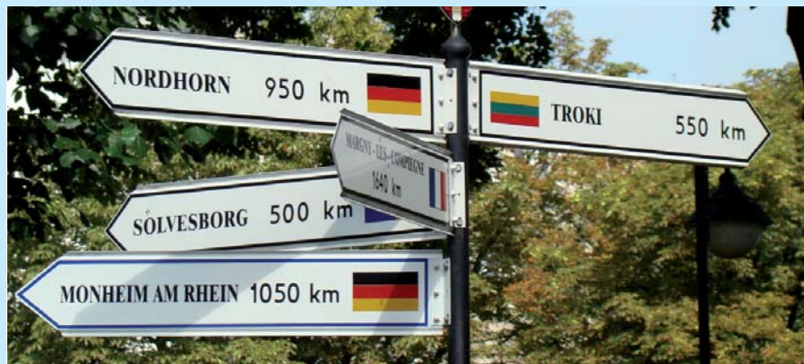
Podczas uroczystości wręczenia Flagi nastąpiło również odświeżenie tablic z nazwami i herbami miast partnerskich oraz zaprzyjaźnionego miasta Larvik na Skwerze Miast Partnerskich w Malborku.