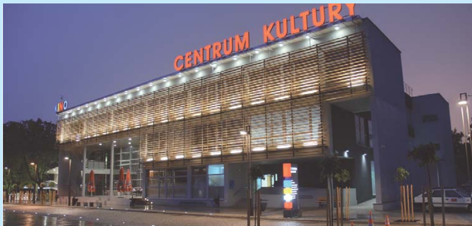
Centrum kultury w Grodzisku Mazowieckim – jedna ze sztanदारowych inwestycji miasta.

Grodzisk Mazowiecki – najlepszy wśród gmin miejskich i miejsko-wiejskich – ma ambicje być najlepszym miejscem do zamieszkania wśród gmin leżących wokół Warszawy. W ciągu ostatnich dziewięciu lat liczba mieszkańców gminy zwiększyła się o 20,8%. Dzięki napływowi nowych osób dynamicznie zwiększają się dochody budżetu. A to