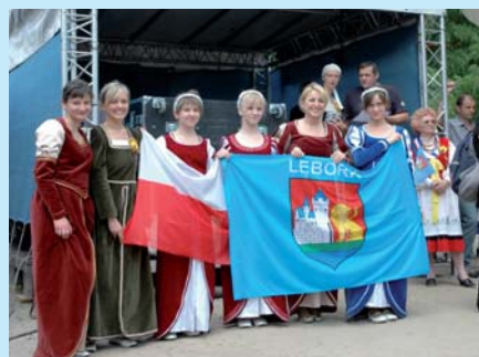
Zespół LUZ z Młodzieżowego Domu Kultury podczas występów w ramach obchodów Międzynarodowych Dni Hanzy w mieście Salzwedel w Niemczech w 2008 r.

W 2001 r. Lębork przystąpił do kręgu miast partnerskich, w skład którego wchodzi miasta: Lauenburg w Niemczech, Dudelange w Luksemburgu oraz Manom we Francji. W 2008 r. pod-