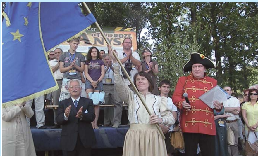
Podczas uroczystości wręczenia Flagi burmistrz Nysy wystąpiła w historycznym stroju Nysanki.

Twierdza – platformą współpracy rockowej młodzieży Euroregionu Pradziad”, „Partnerstwo Nysy i Złotych Hor na rzecz promocji Twierdzy Nysa”, „Utrwalone w kadrze pejzaże Ziemi Nyskiej”.