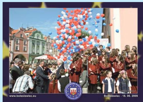
Uroczystości wręczenia Flagi Europejskiej na rynku w Bolesławcu.