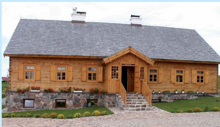
Litewskie Centrum Kultury Ludowej.

Koszty przedsięwzięcia to wynagrodzenia 8 pracowników – 210 087 zł, zakupy i opłaty, szkolenia – 210 226 zł (w roku 2008), a także koszty finansowe poniesione w ramach realizowanych projektów – 996 534 zł.