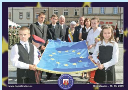
Prezydent miasta przekazał Honorową Flagę Rady Europy uczniom bolesławieckich szkół.

granicami – Międzynarodowy Plener Ceramiczno-Rzeźbiarski, „Bolesławiec w Europie – Dni Miasta”.