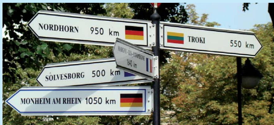
Podczas uroczystości wręczenia Flagi nastąpiło również odświeżenie tablic z nazwami i herbami miast partnerskich oraz zaprzyjaźnionego miasta Larvik na Skwerze Miast Partnerskich w Malborku.