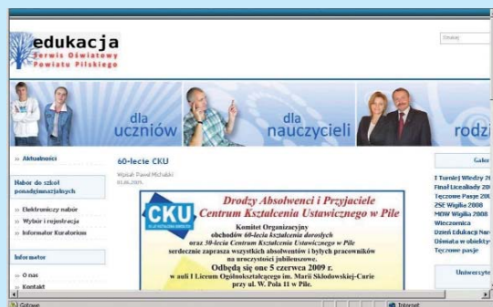
Serwis Oświatowy Powiatu Pilskiego.

Efektom wdrożonego rozwiązania jest przyjazny klimat wokół pilskich szkół (wysoki nabór), we wszystkich szkołach funkcjonują aktualizowane na bieżąco strony internetowe, lepiej działają sekretariaty szkół, komunikacja pomiędzy Starostwem i szkołami odbywa się zazwyczaj drogą internetową, rzecznicy prasowi systematycznie przesyłają informacje do powiatowego serwisu oświatowego, który upowszechnia działania szkół (liczne pozytywne publikacje w prasie i TV), zwiększyła się integracja środowiska oświatowego powiatu (folder promocyjny). Koszty finansowe przedsięwzięcia to 24 600 zł.