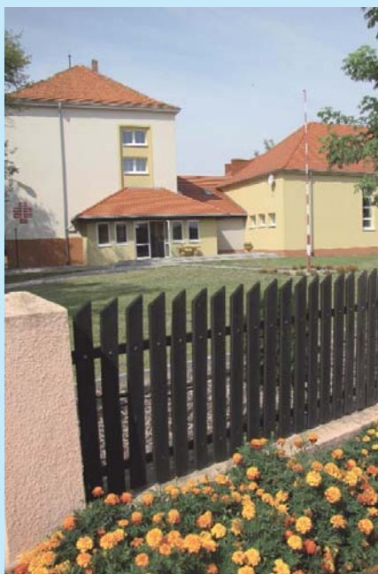
Budynek niepublicznego zespołu szkół w Potarżycy po termomodernizacji dokonanej przez gminę. Tutaj znajduje się jedyne w Polsce (i prawdopodobnie w Europie!) przyszkolne, działające na terenie wiejskim planetarium.

W Jarocinie już od 2003 r. wprowadzono gminne zasady finansowania oświaty (m.in. tzw. bon oświatowy), mechanizmy rynkowe i konkurencję w sferze usług edukacyjnych i wychowania przedszkolnego. Uznano, że edukacja może być dużo efektywniej realizowana przez podmioty niepubliczne niż publiczne, dlatego zamiast likwidować szkoły oddano je w ręce stowarzyszeń, w których wiodącą rolę odgrywają rodzice uczniów. W gminie jest obecnie 10 niepublicznych przedszkoli (9 stowarzyszeniowych) i 7 gminnych, 6 stowarzyszeniowych szkół podstawowych i 9 gminnych, 4 niepubliczne gimnazja (3 stowarzyszeniowe) i 6 gminnych. Zatrudnionych w placówkach niepublicznych nauczycieli nie obejmuje Karta Nauczyciela, co pozwala dyrektorom różnicować ich wynagro-