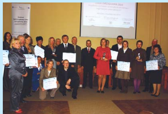
Laureaci i wyróżnieni w konkursie „Samorządowy Lider Zarządzania – Współpraca jednostek samorządu terytorialnego z organizacjami pozarządowymi”.

Dyskutowano m.in. o wpływie kultury na rozwój miast, marketing i markę.