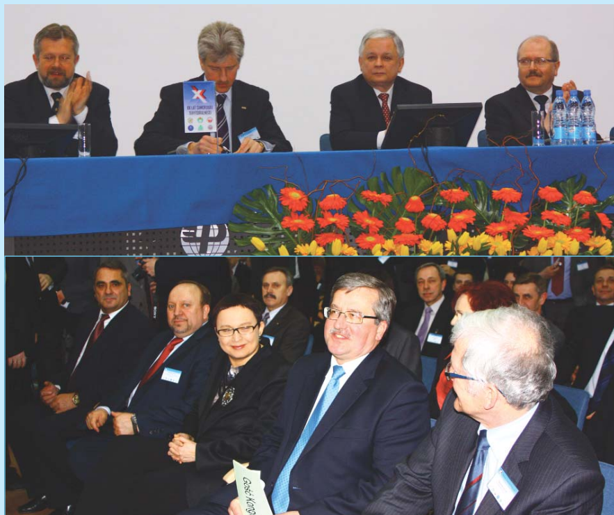
Gośćmi Kongresu XX-lecia Samorządu Terytorialnego byli zarówno ówczesny Prezydent RP, Lech Kaczyński, jak i obecna głowa państwa, wówczas marszałek Sejmu, Bronisław Komorowski.

Projekt systemowy „Model współpracy administracji publicznej i organizacji poza-