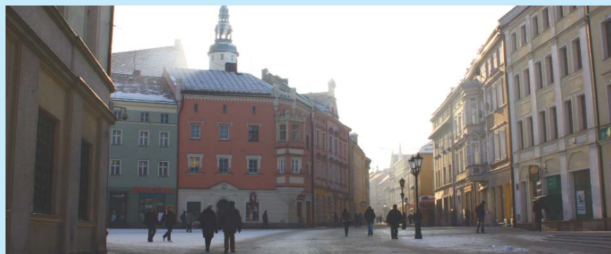
Starówka w Złotoryi.

Na podstawie materiałów z miasta przygotowała HANNA HENDRYSIK