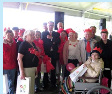
Piknik dla śremskich seniorów „Zjawiskowo” 2009.

Do pracy w ramach śremskiego Centrum zaangażowało się 9 instytucji: OPS, biblioteka publiczna, Powiatowe Centrum Pomocy Rodzinie, Wielkopolskie Stowarzyszenie „Pokolenie”, Fundacja na rzecz Rewaloryzacji