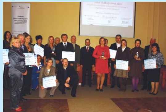
Laureaci i wyróżnieni w konkursie „Samorządowy Lider Zarządzania – Współpraca jednostek samorządu terytorialnego z organizacjami pozarządowymi”.

Dyskutowano m.in. o wpływie kultury na rozwój miast, marketing i markę.