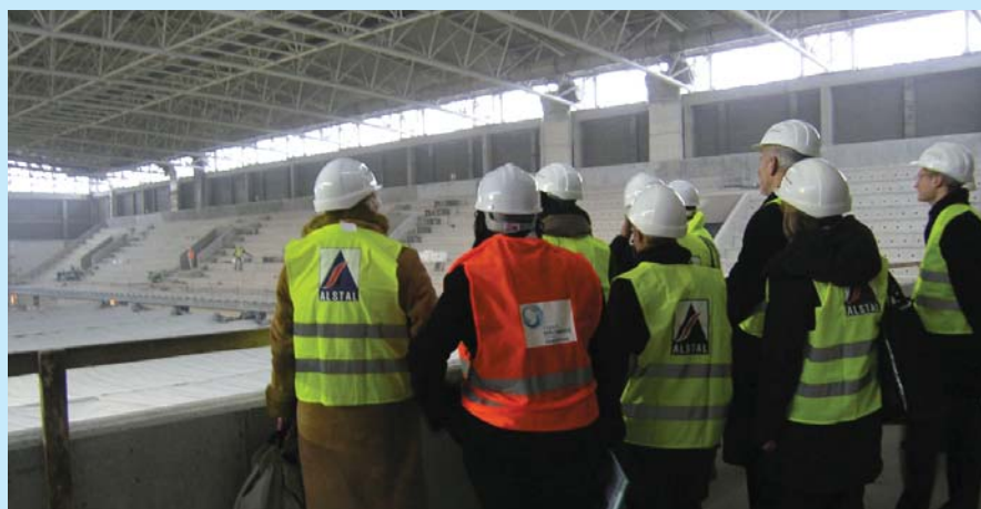
Przed posiedzeniem członkowie Zarządu zwiedzali w Poznaniu budowę Term Maltańskich.

W poczet miast członkowskich przyjęto Gliwice. Ze Związku wystąpił Jawor, Zawidów i Lubaczów.