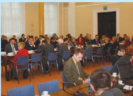
Uczestnicy styczniowego posiedzenia Komisji Wspólnej.

Nie udało się dojść do porozumienia również w sprawie projektu założeń do ustawy o organizowaniu i prowadzeniu działalności kulturalnej. Zakłada on m.in. możliwość łączenia instytucji kultury mających różne formy organizacyjne, np. łączenie bibliotek z innymi instytucjami (pod warunkiem że nie ucierpią na tym realizowane dotąd zadania) oraz możliwość ich przekazywania przez samorządy