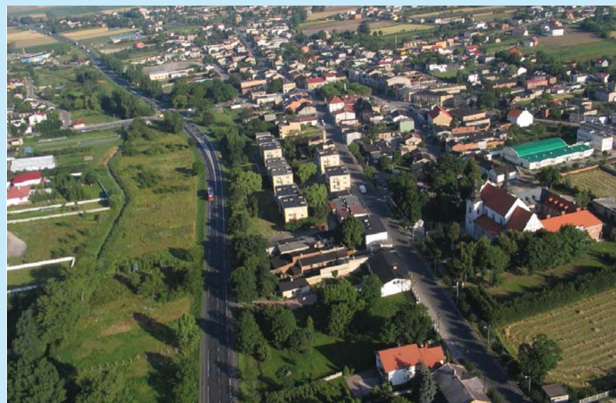
Kłodawa z lotu ptaka.

Te wszystkie realizacje w połączeniu z budową separatora do kanalizacji deszczowej pozwoliły miastu na uzyskanie w latach 2006, 2007, 2008 tytułu Gmina Przyjazna Środowisku. Dzięki tym inwestycjom możliwe było w roku 2009 objęcie prawie wszystkich mieszkańców miasta systemem zbiorczej kanalizacji sanitarnej. Ponadto pozwoliło Kłodawie uzyskać w X Edycji Narodowego Konkursu Ekologicznego „Przyjazni Środowisku” dożywotni tytuł MECENASA POLSKIEJ EKOLOGII.