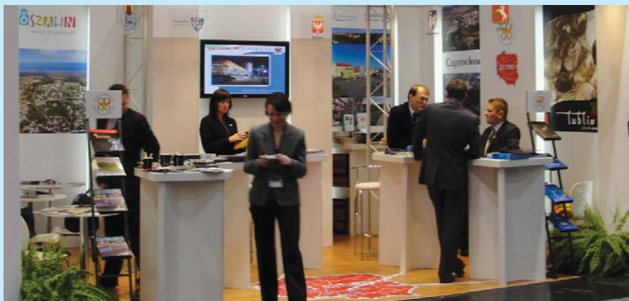
Stoisko Związku Miast Polskich na targach EXPO REAL 2009 w Monachium.

Tym razem do udziału w debacie zaproszono przedstawicieli izb gospodarczych, działających w gospodarce komunalnej oraz Stowarzyszenie MOPS FORUM. Uczestnictwo repre-