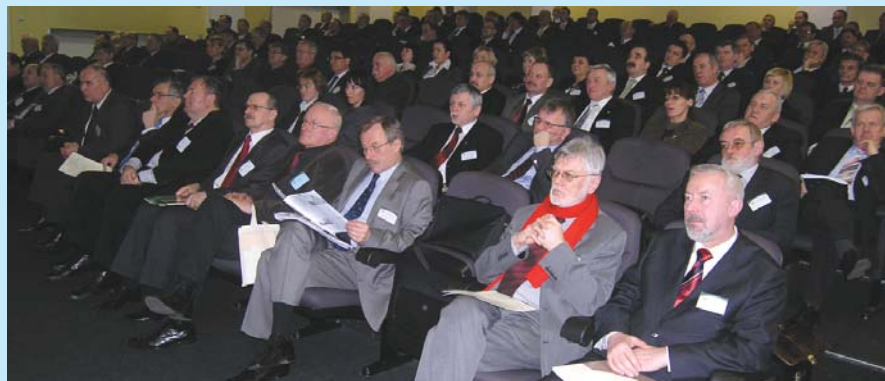
Uczestnicy XXX Zgromadzenia Ogólnego Związku Miast Polskich w Rudzie Śląskiej (19 marca 2009 r.)

Akcją objęto wybrane grupy docelowe: przedstawicieli samorządów lokalnych i re-