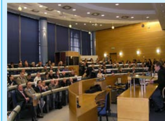
Konferencja została zorganizowana w trakcie trwania Europejskiego Roku Obywateli przez Urząd Miejski w Dąbrowie Górniczej wspólnie ze Związkiem Miast Polskich oraz Pracownią Badań i Innowacji Społecznych STOCZNIA.

dzenie ich na zbyt późnym etapie, poczucie fasadowości i pozorności procesu, brak wiary w to, że urzędnicy uznają zgłaszane opinie oraz konsultowanie nie tego, co jest istotne dla obywateli. Warto przy wszelkich konsultacjach opierać