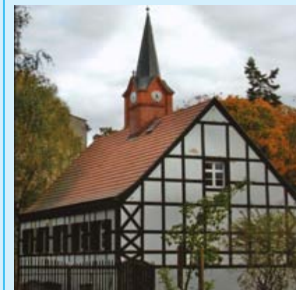
Dom Stanisław Staszica, potocznie zwany Staszicówką (obecnie Muzeum Stanisława Staszica).

W 1755 roku w grodzie nad Gwdą urodził się najwybitniejszy obywatel miasta - Stanisław Staszic. Ten zasłużony przedstawiciel Oświecenia, ksiądz, pisarz, mąż stanu i filozof, zasłynął również jako twórca geologicznej mapy Polski. Był też inicjatorem budowy kopalni węgla kamiennego na Górnym Śląsku.