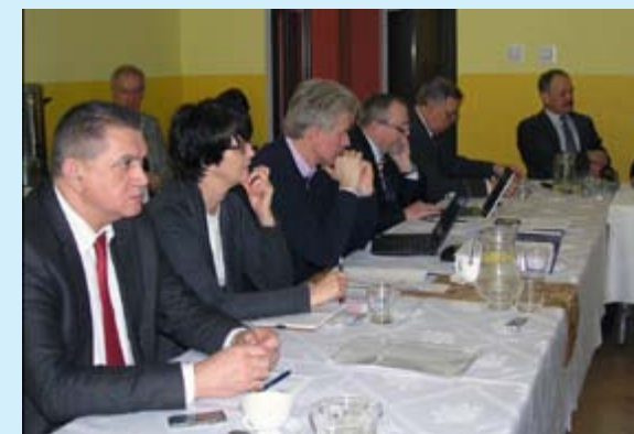
Zarząd ZMP opowiada się za utrzymaniem obecnego zapisu dotyczącego ustawy o gospodarce komunalnej, który umożliwia funkcjonowanie spółkom gminnym ważnym dla rozwoju gminy