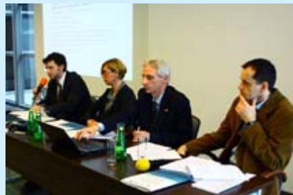
Głównym powodem styczniowej konferencji informacyjnej dla partnerstw było ogłoszenie przez przedstawicieli MRR naboru wniosków do konkursu grantowego w ramach Programu Regionalnego.

Strategie czy też plany przygotowane przez partnerstwa powinny obejmować