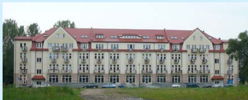
Dzięki adaptacji budynku pokoszarowego pozyskano w Ełku 66 lokali mieszkalnych.

Przewidywany koszt inwestycji to 7 294 053 zł, a rzeczywiste koszty inwestycji - 5 508 171 zł. Projekt został dofinansowany z Funduszu Dopłat BGK (wsparcie w wysokości 40% kosztów kwalifikowanych) w kwocie: 1 673 417 zł, przy czym środki własne samorządu stanowiły 69,6% kosztów inwestycji i wyniosły 3 834 754 zł. ■