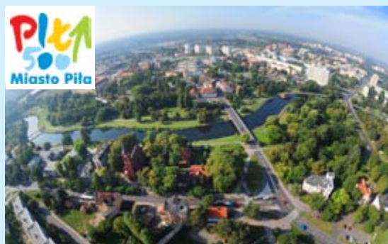
Piła z lotu ptaka.

Dziś jest Piła regionalnym ośrodkiem gospodarczym, kulturalnym i naukowym - uczy się tu ponad cztery tysiące studentów, m.in. w Państwowej Wyższej Szkole Zawodowej, niepublicznej Wyższej Szkole Biznesu oraz w filii poznańskiego Uniwersytetu im. Adama Mickiewicza. Ścisła współpraca piłskich uczelni z uniwersyteckimi ośrodkami w kraju ułatwia młodzieży kontynuację edukacji na specjalistycznych kierunkach.