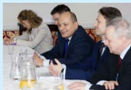
Spotkanie polskiej delegacji do CLRAE z Wice gubernatorem Banku Rozwoju Rady Europy.

szczeblu lokalnym i regionalnym w Rosji wygłosiła Walentyna Matwijenko , Szefowa Rady Federacji Rosyjskiej. Sporo miejsc poświęcono też sytuacji w Turcji. Polska Delegacja wzięła również udział