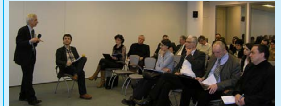
W trakcie spotkania uczestnicy konferencji pytali przedstawicieli MRR m.in. o sposób liczenia punktów, rozliczania dodatku zadaniowego jako kosztu kwalifikowanego, o realny okres rozpoczęcia realizacji projektów, które dostaną dofinansowanie, o formy umowy partnerskiej.

Zakres działania partnerstw w Europie zwykle skupia się na jednym celu, czasem realizują one różne rodzaje usług i zadań. Dominują układy współpracy horyzontalnej, a wertykalne układy (samorząd lokalny, regionalny, agencje rządowe) najczęściej są