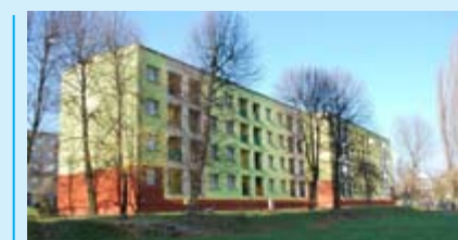
Istotnym efektem prowadzonych działań jest ograniczenie emisji gazów cieplarnianych do atmosfery. Dodatkowy atut to uatrakcyjnienie obiektu dzięki odnowieniu elewacji budynków, co wpływa korzystnie na wizerunek miasta oraz samych osiedli.

Zakres wykonania termomodernizacji obejmował 8 budynków wspólnot mieszkaniowych. W ocieplonych budynkach znajduje się łącznie 351 lokali mieszkalnych. Termomodernizacja budynków wielorodzinnych polegała na: ociepleniu ścian zewnętrznych, stropodachów i stropów piwnicznych, wymianie okien na klatkach schodowych, wymianie stolarki drzwiowej, wykonaniu regulacji instalacji c.o. polegającej na założeniu zaworów termostatycznych z głowicami