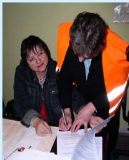
Rezultatem wdrożenia programu jest m.in. odzyskanie należności w kwocie prawie 400 000 zł oraz odpracowanie długu w kwocie około 200 000 zł.

spłaty. Drugi krok - zamiana mieszkania mająca na celu dostosowanie warunków mieszkaniowych do potrzeb i możliwości płatniczych lokatora, w tym obejmująca zamianę ze spłatą długu. Zamiana realizowana jest poprzez reaktywowane Biuro Zamiany Mieszkań. Trzeci krok - odpracowanie długu, czyli program „Dozorca”.