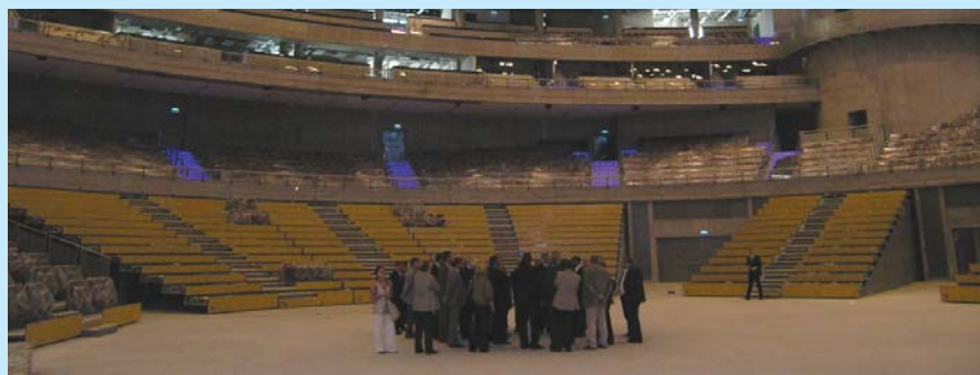
Członkowie Zarządu ZMP zwiedzili halę sportowo-widowiskową budowaną na granicy Sopotu i Gdańska.

pozytywną opinię uzyskał projekt o zmianie ustawy Prawo energetyczne, Prawo ochrony środowiska, rozporządzenia MZ w sprawie sposobu przechowywania zwłok i szczątków oraz dokument „Kierunki rozwoju funduszy pożyczkowych i poręczeniowych dla małych i średnich przedsiębiorstw w latach 2009–2013”. Negatywnie z kolei ustosunkowano się do projektu założeń do zmian w ustawie Prawo o ruchu drogowym, gdyż rodzi skutki finansowe. Odrzucono też „kompromisowy” projekt założeń ustawy „śmieciowej”, który nie tworzy jednolitego systemu dla całego kraju i jest nawet gorszym rozwiązaniem niż to, które obowiązuje obecnie. Podjęto także stanowisko w sprawie planowanych zmian w organizacji administracji architektoniczno-budowlanej i nadzoru budowlanego.