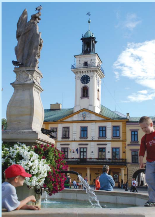
Ratusz i rynek w Cieszynie.

– Współdziałamy na różnych polach. Ważną sprawą jest, że dwa razy w roku rady miejskie Cieszyna i Czeskiego Cieszyna spotykają się na wspólnych sesjach – raz w Polsce, raz w Czechach. I uzgadniamy strategiczne rozwiązania dotyczące np. komunikacji, planów zagospodarowania przestrzennego, ubiegamy się wspólnie o środki finansowe z Unii Europejskiej. Zrealizowaliśmy właśnie projekt „Cieszyn, Czeski Cieszyn – ogród dwóch brzegów”, czyli rewitalizację nadbrzeża Olzy. Kończymy projekt „Rewitalizacja Parku”, w ramach którego rewitalizujemy przestrzeń parkową po obu stronach granicy: u nas Górę Zamkową, po czeskiej stronie – Masarykowe Sady. Następny