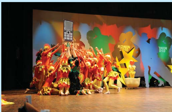
Międzynarodowy Dziecięcym Festiwal Piosenki i Tańca „Konin 2010”. Fot. Archiwum UM

Wydział Promocji i Współpracy z Zagranicą, UM w Koninie