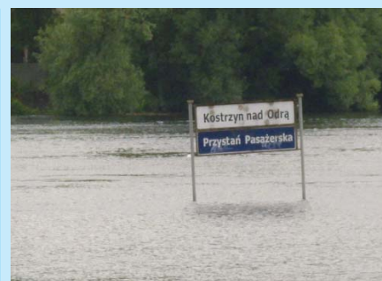
Ciężkie chwile przeżywali mieszkańcy położonego na zachodniej granicy Polski Kostrzyna nad Odrą.

Bielsko-Biała to z kolei miasto, które otrzymało największe wsparcie finansowe w województwie śląskim. Tutaj również pieniądze zostały przyznane na remont i odbudowę obiektów komunalnej infrastruktury technicznej zniszczonych przez wielką wodę w maju i czerw-