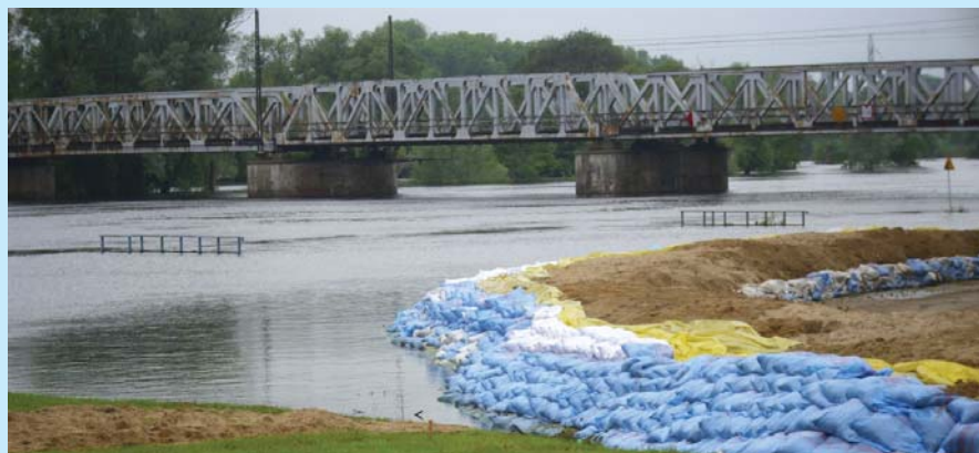
Mimo że największe straty i zniszczenia podczas tegorocznej powodzi poczyniła Wisła, także samorzady miast leżących nad Odrą i Wartą stoczyły walkę z żywiołem. Wzdłuż Odry i Warty zabezpieczano wały przeciwpowodziowe na najbardziej zagrożonych odcinkach.