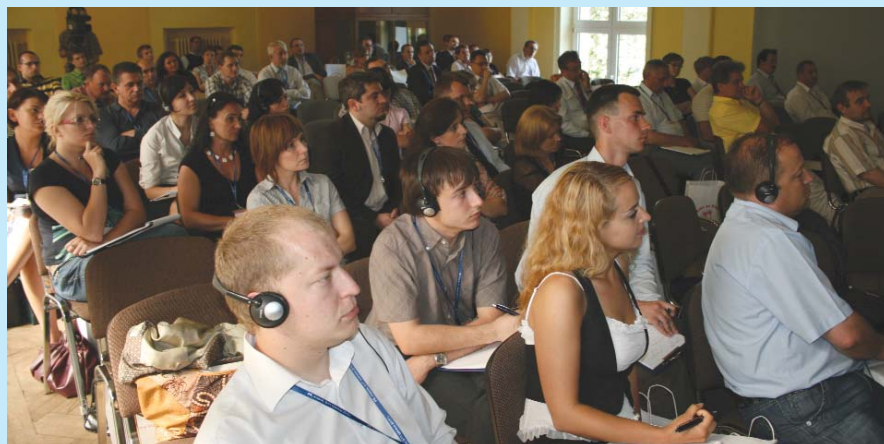
Ponad 150 osób odpowiedzialnych za PR w swoich urzędach, rzeczników prasowych, jak i znanych praktyków i szkoleniowców z branży przez trzy dni rozmawiało o roli i miejscu PR-u w samorządzie.