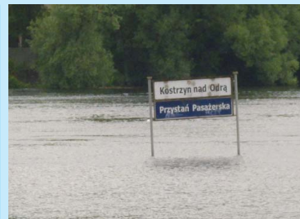
Ciężkie chwile przeżywali mieszkańcy położonego na zachodniej granicy Polski Kostrzyna nad Odrą.

Bielsko-Biała to z kolei miasto, które otrzymało największe wsparcie finansowe w województwie śląskim. Tutaj również pieniądze zostały przyznane na remont i odbudowę obiektów komunalnej infrastruktury technicznej zniszczonych przez wielką wodę w maju i czerw-