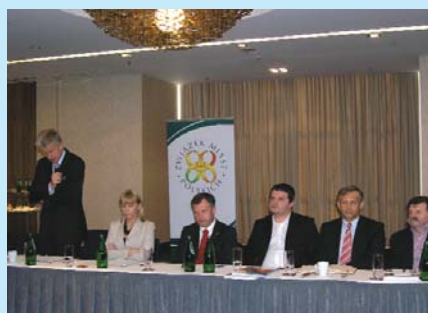
W posiedzeniu Zarządu uczestniczyła minister rozwoju regionalnego Elżbieta Bieńkowska.

Członkowie Zarządu zaopiniowali projekty ustaw dotyczących powodzi. Projekt rządowy o szczególnych rozwiązaniach związanych z usuwaniem skutków powodzi z maja 2010 r.