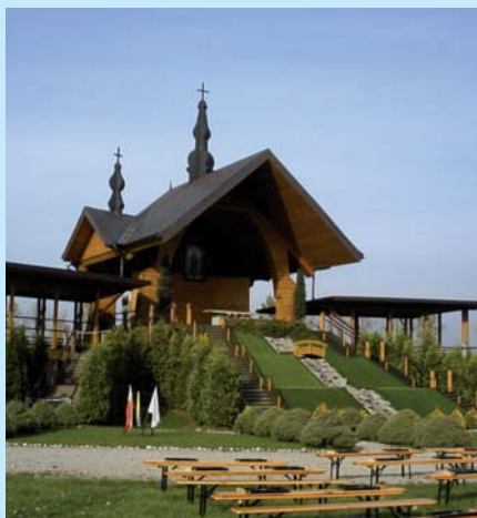
Ółtarz w Starym Sączu, gdzie 16 czerwca 1999 r. Ojciec Święty Jan Paweł II dokonał kanonizacji bł. Kingi.