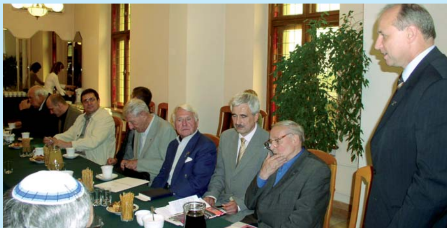
Spotkanie w sprawie kopca w sierpniu 2005 r. z udziałem inicjatora prof. Józefa Szajny.