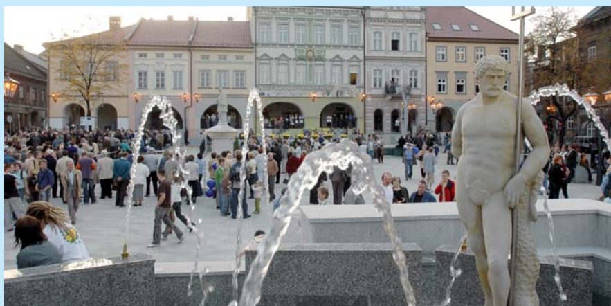
Odnowiony Rynek jest obecnie chętnie odwiedzany przez przyjezdnych i mieszkańców Bielska-Białej, których przyciągają nie tylko odbywające się tutaj koncerty czy wernisaże, ale urokliwość tego miejsca.

Starówki istotny wpływ miała pospieszna i chaotyczna odbudowa po pożarach miasta