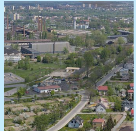
Obszar objęty rewitalizacją w Ostrowcu Św.

W 1999 r. Rada Miejska podjęła uchwałę w sprawie opracowania studium uwarunkowań i kierunków zagospodarowania przestrzennego. W 2001 r. dokonano zmiany w miejscowym planie zagospodarowania przestrzennego miasta obejmującej grunt o powierzchni 80 ha oraz znaczny majątek w postaci hal produkcyjnych. Kolejnym krokiem było włączenie tego terenu do podstrefy Specjalnej Strefy Ekonomicznej w Starachowicach. W 2000 r. powołano Agencję Rozwoju Lokalnego S.A. ze 100-procentowym udziałem gminy, podjęto uchwałę w sprawie ulg i zwolnień z podatku od nieruchomości, a w 2004 r. przyjęto „Program pomocy przedsiębiorcom inwestującym na terenie miasta”,