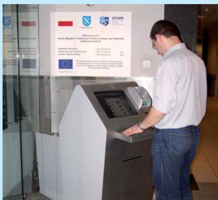
Infokiosk w UM.

Projekt Elektronicznej Karty Miejskiej ma innowacyjny charakter w skali całego kraju. Do tej pory żaden samorząd nie stworzył podobnego systemu. Ma kompleksowy charakter i jest w pełni zintegrowany. Elektroniczny bilet, funkcjonujący od listopada 2006 r., umożliwia płaćenie za przejazd autobusami Zarządu Transportu Zbiorowego (ZTZ). Już