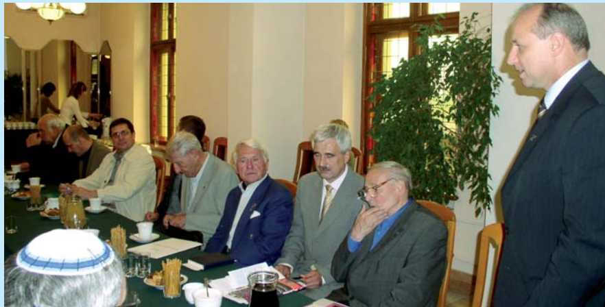
Spotkanie w sprawie kopca w sierpniu 2005 r. z udziałem inicjatora prof. Józefa Szajny.

Tę inicjatywę popierają przedstawiciele Organizacji Narodów Zjednoczonych, Parlamentu Europejskiego, UNESCO, politycy, artyści, duchowni, naukowcy, przedstawiciele gmin żydowskich, stowarzyszeń Romów i wielu organizacji międzynarodowych. Kopiec ma mieć charakter ponadnarodowy i ponadwyznaniowy. Z całego świata przekazywane są symboliczne kamienie, które staną się częścią Kopca Pamięci i Pojednania w Oświęcimiu – Mieście Pokoju.