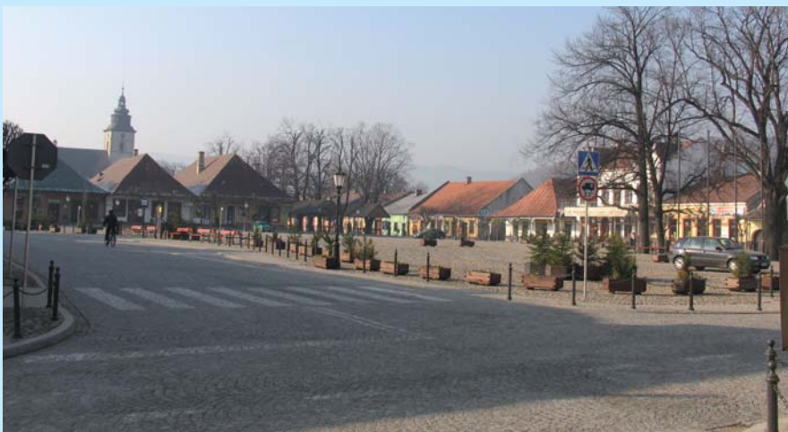
Sredniowieczny Rynek w Starym Sączu.

W Starym Sączu muzyczne tradycje są pieczołowicie pielęgnowane. Na stałe w kalendarz wydarzeń kulturalnych wpisał się znany zarówno w kraju, jak i za granicą Festiwal Muzyki Dawnej, stanowiący nawiązanie do wspaniałych tradycji klasztoru klarysek. I chociaż w ostatnich latach twórcy biorący udział