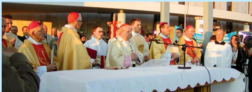
W dniu urodzin Karola Wojtyły, 18 maja, w Sanktuarium Bożego Miłosierdzia w krakowskich Łagiewnikach odbyła się uroczystość poświęcenia Krzyża i Msza Święta w intencji Centrum Jana Pawła II „Nie lękajcie się!”.