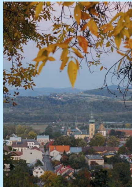
Widok miasta w cieniu jarzębiny...

Dzięki zakonowi rozwijała się w Starym Sączu nauka. Klaryski prowadziły