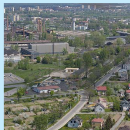
Obszar objęty rewitalizacją w Ostrowcu Św.

W 1999 r. Rada Miejska podjęła uchwałę w sprawie opracowania studium uwarunkowań i kierunków zagospodarowania przestrzennego. W 2001 r. dokonano zmiany w miejscowym planie zagospodarowania przestrzennego miasta obejmującej grunt o powierzchni 80 ha oraz znaczny majątek w postaci hal produkcyjnych. Kolejnym krokiem było włączenie tego terenu do podstrefy Specjalnej Strefy Ekonomicznej w Starachowicach. W 2000 r. powołano Agencję Rozwoju Lokalnego S.A. ze 100-procentowym udziałem gminy, podjęto uchwałę w sprawie ulg i zwolnień z podatku od nieruchomości, a w 2004 r. przyjęto „Program pomocy przedsiębiorcom inwestującym na terenie miasta”,