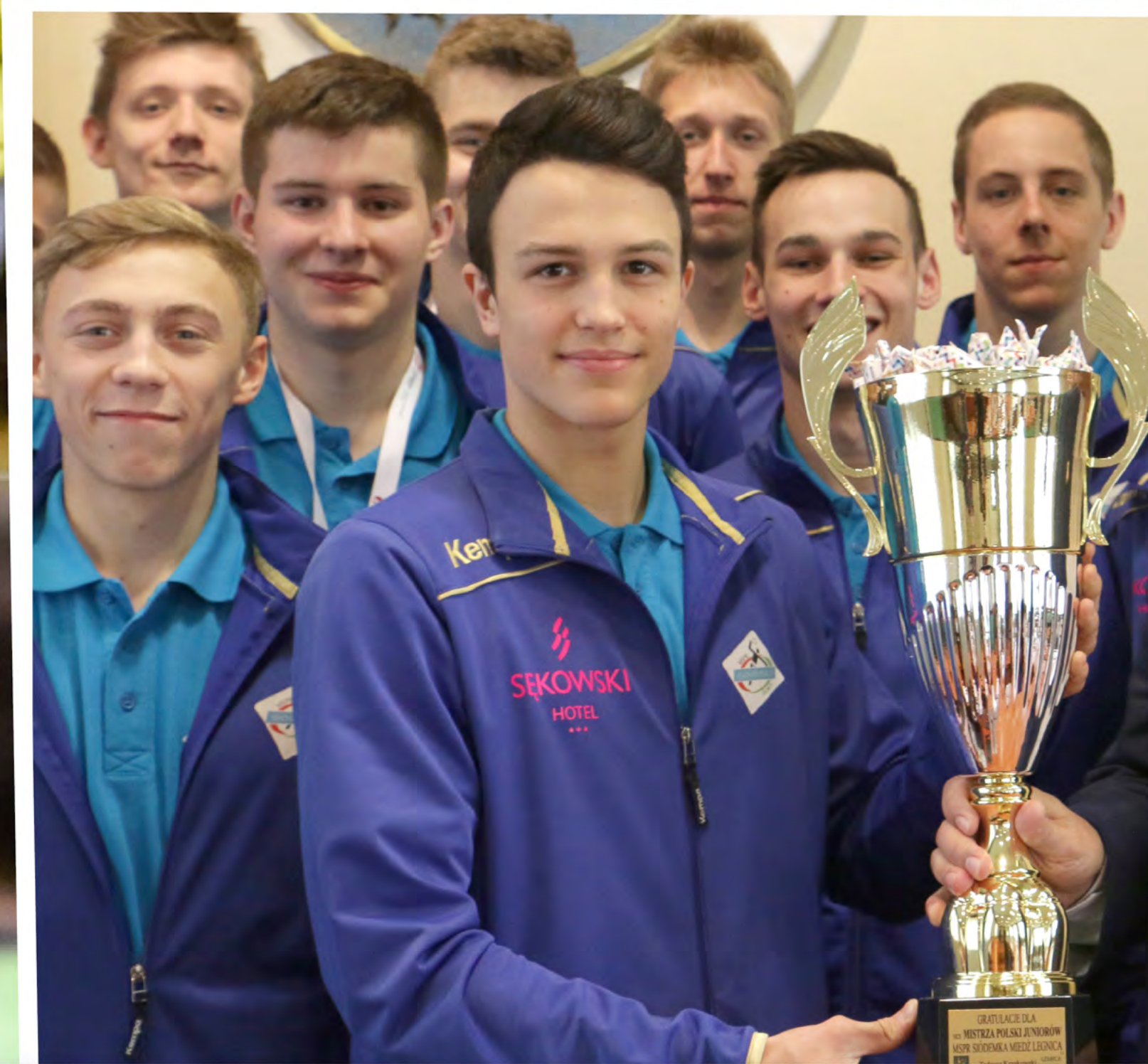
// MSPR „SIÓDEMKA” MIEDŹ LEGNICA – PIŁKA RĘCZNA MĘCZYZN – I LIGA MISTRZ POLSKI JUNIORÓW 2018