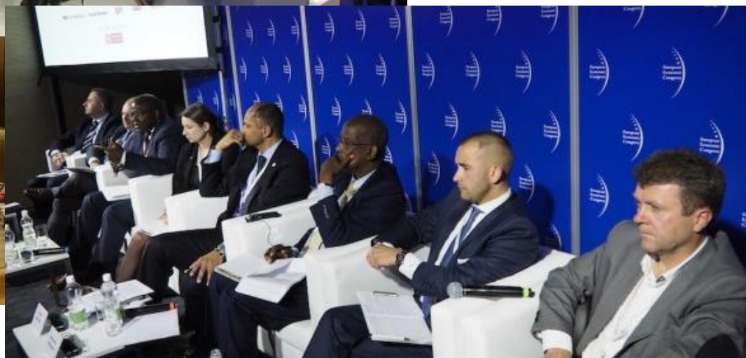
Sesja nt. dyplomacji ekonomicznej, Europejski Kongres Gospodarczy, Katowice 2017