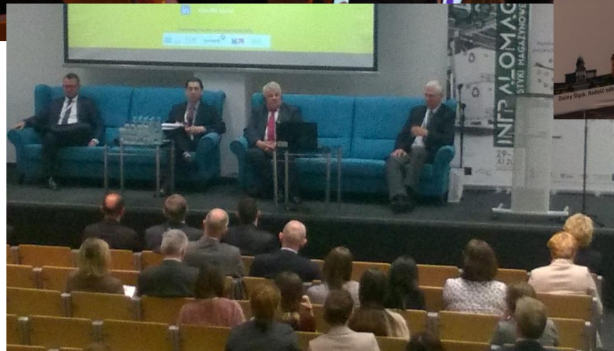
rynki krajów Ameryki Łacińskiej, COIE, Łódź, listopad 2017 r.