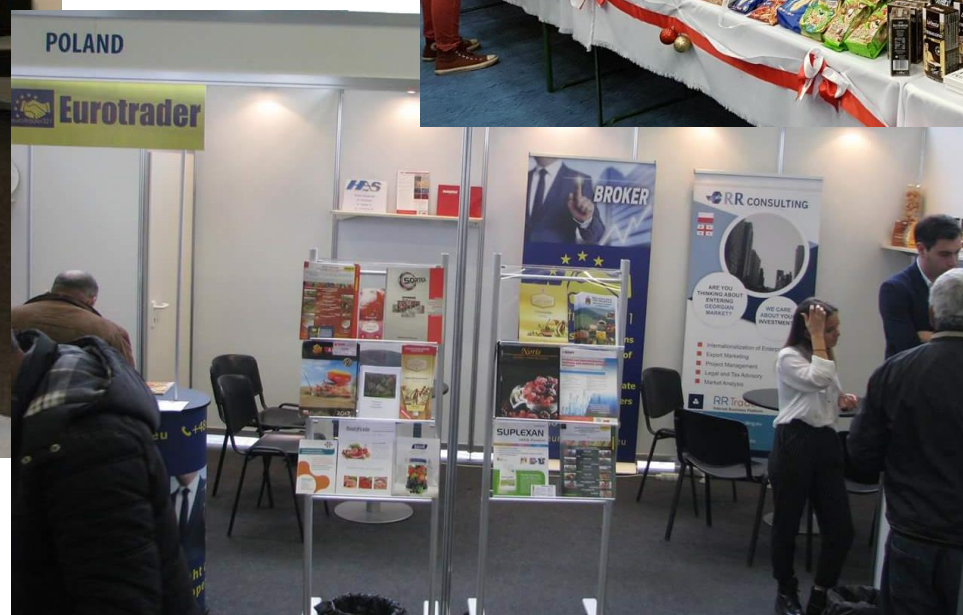
polskie stoisko na targach Moldagrotech-Farmer , Kiszyniów, październik 2017 r.