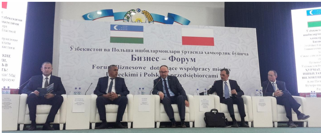
forum biznesowe w Bucharze, 8 czerwca 2018 r.

Rzeczpospolita Polska Ministerstwo Spraw Zagranicznych