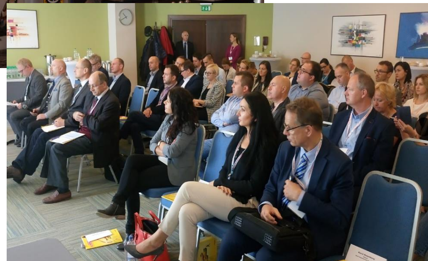
rynek irański, COIE, Bydgoszcz, październik 2017 r.