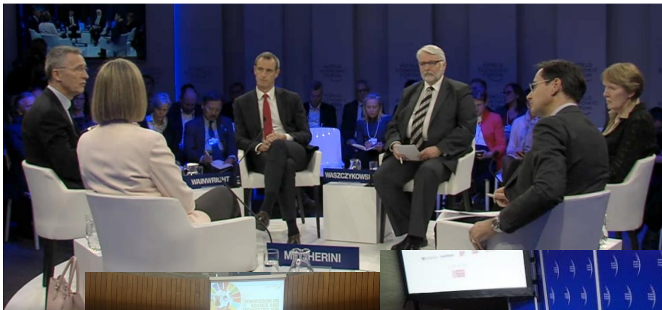
Minister W. Waszczykowski na Światowym Forum Ekonomicznym w Davos, 2017

Rzeczpospolita Polska Ministerstwo Spraw Zagranicznych