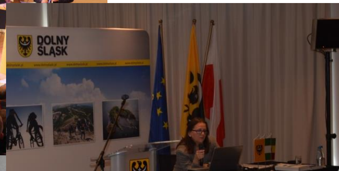
seminarium rynki afrykańskie, Urząd Marszałkowski, Wrocław, kwiecień 2018 r.