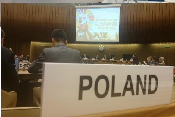
20. sesja Komisji Narodów Zjednoczonych ds. Nauki i Technologii na rzecz Rozwoju (CSTD ), Genewa, 10 maja 2017 r.