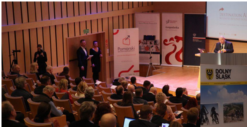
konferencja Business Beyond Borders – Destination Africa , Gdańsk, marzec 2018 r.

Rzeczpospolita Polska Ministerstwo Spraw Zagranicznych