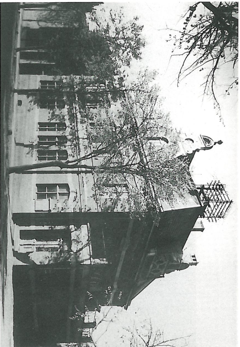
Bursa gimnazjalna (po przebudowie siedziba Poczty i Telekomunikacji) przy ul. Gdanskiej, ok. 1934 r.